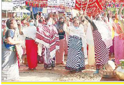
হিয়াংলাং এ সীগী ইন্টেব্দিং কেন্দ্রদেট নোংমাইথৈম সঞ্জয়গী য়ুমদা বোম অমসুং নোংমৈ মরু থামজিহ্নদগী মায়োজা সেকমাযিজন থোংথোঙদা নুপীশিংনা প্রোটেষ্ট তৌখিবা