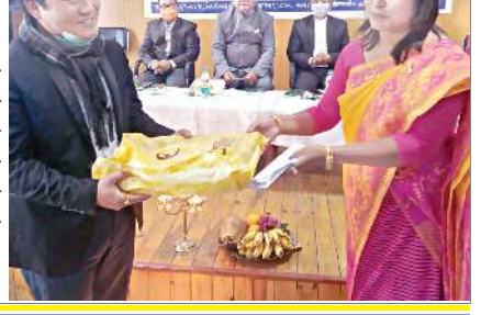
পল্লিক লাইব্রেরি, ময়াং ইয়ানলা শীন্দুনা মণিপূর এসেমব্লিগী মুজিয়াম অমসুং আর্কাইভসত পাঙথোকখিবা যৌরমদা অহানবা পল্লিক লাইব্রেরি পোইত্রি এরাব, ২০২১ হাওবম সত্বেতিনা লায়েকখিবা