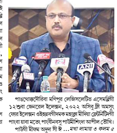
পাঙথোক্কদৌরিবা মণিপূর লেজিসলেটিভ এসেমব্লিগী ১২শুবা জেনেরেল ইলেক্সন, ২০২২ অসিবু স্ট্রী অমসুং ফের ইলেক্সন ওইহফবগীদমক মহারাঞ্জ মাদিকা গ্রেটনিটিগী পাংখা য়াবা মতে পাংখাবনবসু পাউশিগীনা আশীল তৌখি।

ইম্ফাল, ১৪ (এচ এন এস) : মথং চহী ২০২২গী মার্চ ১৯ ফাওবগী মমাঙদা মণুং ফনা পুমলেই লৌশিল্লগীদমক মথৌ তাবা থৌরাংশিং চাফ ইলেক্টোনেল ওফিসর (সি ই ও), মণিপূরগী মায়কেন্দগী লেপ্তনা পায়থলকপনা লৌশিল্লকপনা ইয়োয়ননা মীখল পাঙথোক্কদৌরিবা অপনবা এসেমব্লি সেগমেন্ট ৬০গী মনুংদা ৭-অস্ত্রো, ২২-রাঙ্গোই, ২৩-ময়াং ইয়ানলা, ২৮-থাঙ্গ, ৩০-লিলোং অমসুং ৫৮-চুচাচন্দ্রপূর (এস টি) বু এল্সপেদিচর সেলিটিভ কম্পিউটিংএপিগি ওইনা আইডেন্টিফাই তৌরে হায়বগা লোয়ননা মায়কেন্দগী স্টেটিক সার্ভিলেন্স টিম, ডিডিও সার্ভিলেন্স টিম, ডিডিও ভিউয়িং টিম, একাউন্টিং টিমসু শেহুগা লোয়ননা ড্রেনিং তৌরে অমসুং টিম পুন্নমক অসি ইলেক্সনগী মতম হেক লাউথোকপনা খুদ্তা এলেক্টিভে তৌরগনি হায়রি।