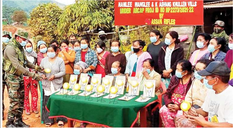
কামজোং দিষ্টিক্টকী মনুং চনবা নামলি, বাংলা অমসুং কে অশাং খুন্সেন খুন্সেনী খুগুশিংদা সংস্ক বটালিয়ন অসাম রাইফলসনা সোলার লেম্পশিং য়েহুেখিবা