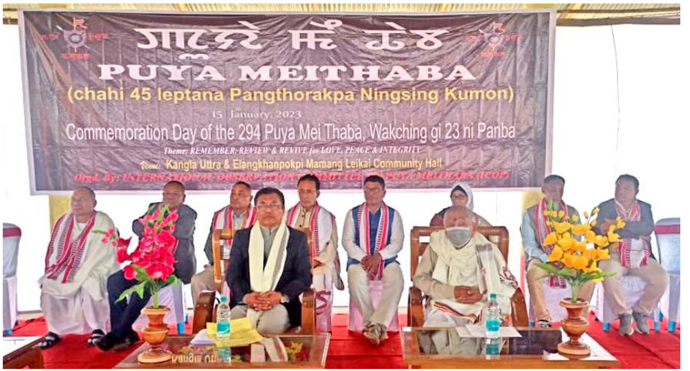
ইকোপনা শীন্দুনা এলাংখাঙপোকপীদা পাঙথোকখিবা কল্লাদা পুয়া মৈ থাখিবা চহী ২৯৪ স্তৱকপগী নীংশিং যৌৱমদা মৰুওইবা মী ওইশিং ওইনা শৱক য়াখিবাশিং

গভৰ্ণমেণ্ট ওফ ইন্দিয়ানা আই এন অমসুং ৰাফিক কমিটি ওফ নাগা নেসনেল পোলিটিকেল গ্ৰুপস (এন এন পি জি) গা মতাংখিবা কুমজা ১৯৯৭ অমসুং কুমজা ২০১৭ দগী তোঙান তোঙান্না দাইলোগ চফাৱা লাকখি। ইন্দিয়া গভৰ্ণমেণ্টনা কুমজা ২০১৫ গী ওগন্ততা আই এমগা ফ্ৰেমৱৰ্ক এপ্ৰিমেন্ট খুংয়েক পীনখি অমসুং কুমজা ২০১৭ গী নবেম্বৰদা এন এন পি জিশিংগী এপ্ৰিড পোজি সন অদু খুংয়েক পীনখি।