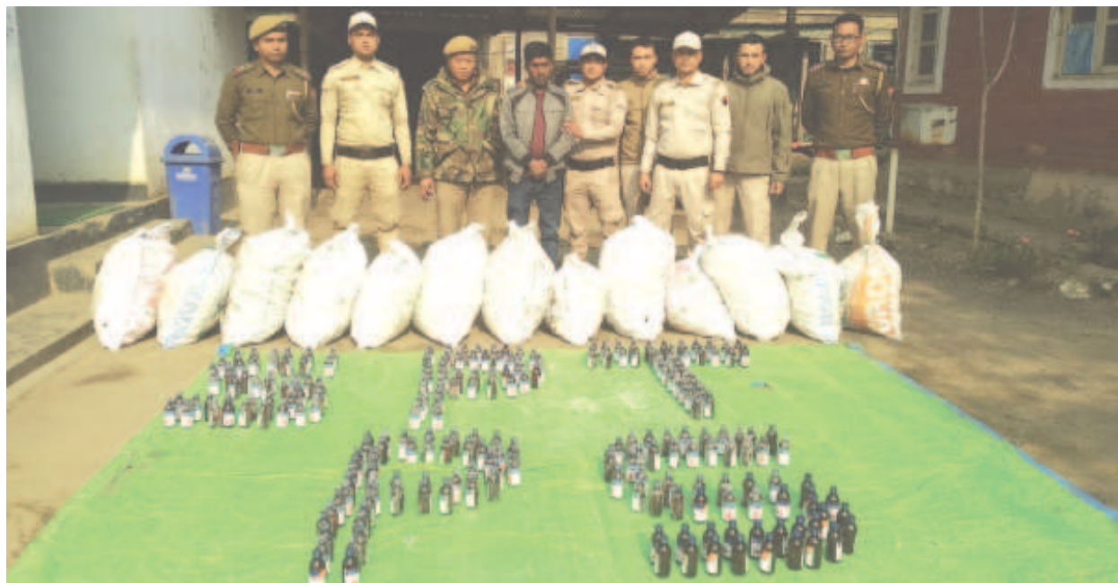
দিমা পুরদনী ইম্ফাল তন্না খোরকপা বস অমদা অয়াবা য়াওদনা পুশিল্লকপা কফ সিরপ বট্টলশিং সেনাপতি পুলিস স্টেশন মনাজা ফাগৎপা