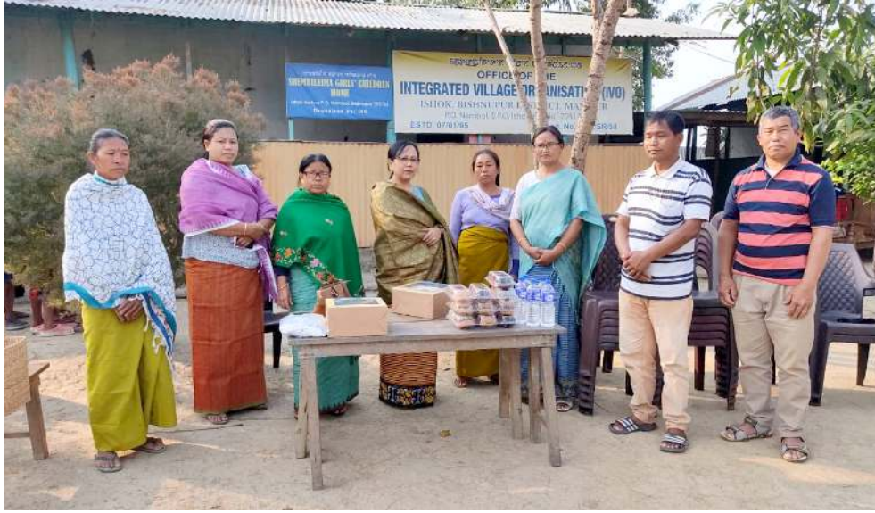
নহোল কেন্দ্ৰগী এম এল এ এন লোকেনগী লায়নবী উয়ানা নহোল ইসোজা লৈবা সেনীলৈমা গাৰ্লস চিলড্ৰেন হোমদা লৈবা অঙাং ৩৫ দা মখোয়ানা শীজিনবা ট্ৰেক স্ট, প্ৰাটিক টোফ্ৰি ৩৫, অমদি চানা থৰুবা পোংলমশিং খুংশিনাথিবা