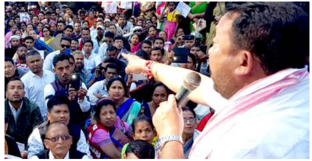
অপংবা শীবা গুমেই। লমদম অসিগী লৈৰিবা মীয়ামু খুদিংমত্ৰা বি জে পিনা চনা কাঙলোন হৌজিক চপ চনা খঙবা গুমে। মৰম অদুনা পাঙথোক্ৰেদিবা ইলেক্ৰন অসিগা বি জে পি

জোৱহাট, মাৰ্চ ১৫ (এজেলি): অসামদা পাঙথোক্ৰেদিবা এসেমব্লি ইলেক্ৰননা বি জে পিনা অমুক হনু মায় পাক্ৰনা লৈঙাক পায়ৱৰুৱদি কুঞ্জি গ্যাসকী মমল লুপা লীশিং ২ অমদি পেট্ৰেলগী মমলনা লিচিবা লুপা ২৫০ যৌৱগনি হায়না জোৱহাট কমিটিয়েদিদা মীৰেপ ওইনা খোজিবা অসাম কোংগ্ৰেসকী লিচিবা ৰনা ধাশামিনা ফোঙদোক্ৰে। মহাক্ৰা মখা তানা ফোঙদোকখিবা বি জে পি অসি লায়ৱৰা মীয়ামগী পাটি নতে। হায়দগী হৌনা শেঞ্জাও পায়দুনা লৈৰবা মীওইশিংগী পাৰ্টিনি। বি জে পিনা লিচিবা লৈঙাক অসিনা মখোয়গা নক্ৰা ব্ৰাজিনেসমেনশিংদা অহেনবা খুদোংচাবা কয় পীদুনা লায়ৱৰা মীয়ামগী চাকখুং মংনবা হোংনরি। অসামদা হৌজিক হৌজিক লৈঙাক পায়ৱৰা বি জে পিনা লমদম অসিগী মীয়ামু মখা তানা