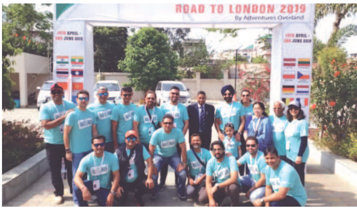
ইম্ফালদগী লন্দন ফাওবা নুমিং ৫০ নি চিন্তা চংকদবা টিপ আই জি এ আর (সাউথ) মেজর জেনরেল কে পি সিংহনা লমথাবগী শক্তম