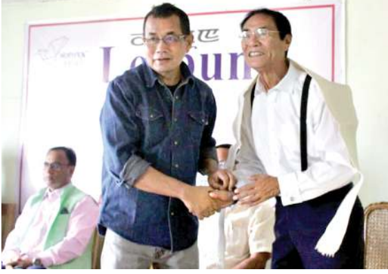
পাউচে অসিগী পল্লিশর সৌবাম নিলখজনা দিক্সনগী মোদরেটর প্রোফেসর দল্লিয় নবকুমার (রিটাইয়র্দ) দা লেংয়ান ফি খুদোলা তরা