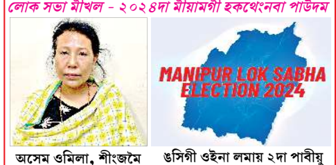
লোক সতা মীখল - ২০২৪দা মীয়ামগী হকথেনবা পাউদম MANIPUR LOK SABHA ELECTION 2024 অসেম ওমিলা, শীংজমৈ ওসিগী ওইনা লামায় ২দা পাবীয়

ইম্ফাল, এপ্রিল ১৫ : যু পি আর এফ এমগী কংলৈপাক (মণিপুর) গী নীংতম যাওল্লপ অমা ওইনা যাওল ঙ্গেই চুখাদুনা লাক্কিবা কুমাঞ্জা ৬ ফরকপগা লোয়ননা লুপকী ৬শুবা বেজিং দেগী থৌরম ওসি এপ্রিল ১৫, ২০২৪ লাক্কদা লুপকী জেনরেল হেদ কাউন্সিল, ডিভিজনেল, সেক্টরেলে অমসুং টেক্টিকেল মোবাইল য়ুনিটকী এরিয়াশিংদা তোঙান তোঙানবা থৌরমশিং লুপকী কেদরশিংনা শরক য়াদুনা পাঙথোকপ্রে হায়বগা লোয়ননা কুমওন থৌরম অসিগা মরী লৈননা কংলৈপাক অমসুং ... মখা লামায় ৬ কলম ৫