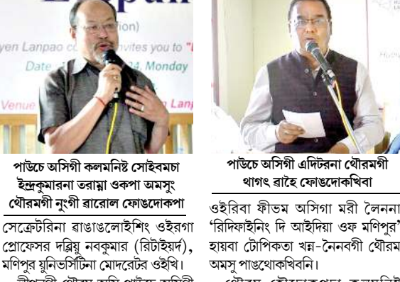
পাউচে অসিগী এডিটরনা থৌরমগী থাংগে রাইহে ফোঙদোকখিবা