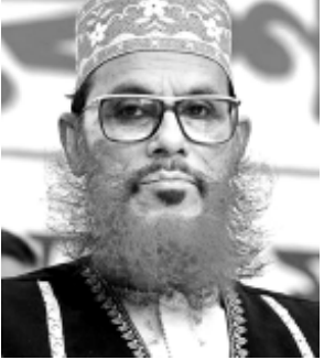
দিফেস্ অনীমক্ৰা কুমজা ২০১৪ গী সুপ্ৰিম কোৰ্টকী ডাৰ্জিঙ্গ অদুৱি ৰিভিভু তৌনবা হায়জৱদনা পিটিসনশিং ফহিলে টোখিবনি। ষ্টেটকী মায়কৈন্দী শিবগী চৈৱাক পীনবা হায়ৰকখিবনা দিফেলনা মৱাল কোকপীনবা হায়জখিবনি।

ধাকা, মে ১৫: কুমজা ১৯৭১ দা শোক্ৰ খিবা নিংত্ৰা লালদা পাকিস্তানি ক্ৰেপশিংগী মিচং চপ্ৰশিন্দনা মীওইবা কাঙলুপকী মায়েজা ক্ৰাইম কয়া টোখিবা ইল্লামিক প্ৰিভাৰ অমদা পীথিবা পুলি চুগ্ৰা জেলদা থল্লবগী চৈৱাক বাংলাদেশকী এপেক্স কোৰ্টনা শৌগংথ্বে।