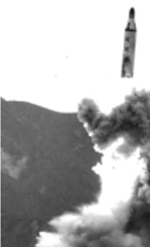
ৱাৱহেদ অমা পুবা গুমই অনৌবা হৰাগোং-১২ অমনি। কিমনা ৱোকট ৱিছাৰ্চকী লমদা লৈৱাৰা ওফিসলশিংবু থাগংলদুনা অচৌবা পোংশক অমা ফংনবা মখোয়না কয়া শ-নোমখি হায়ৰি।

অনৌবা মিসাইল অমা কাপুনা মায় পাল্লা চাংয়েং তৌখৰা মতুংদা হৌজিক য় এসকী মপুং লম অসি নোৰ্থ কোৱিয়ন মিসাইলশিংনা যৌশিনবা গুগ্ম লমগী মনুং চমা লৈৱে হায়না পিযোগাংনা ক্ৰেম তৌগে। চাংয়েংদা মায় পাকস্ৱৰা মিসাইল অদু অচৌবা, অৱশ্য ন্যুক্লিয়ৰ ৱাৱহেদ অমা পুবা গুমই হায়নসু পিযোগাংনা মখা তানা ফোণ্ডোকখি।