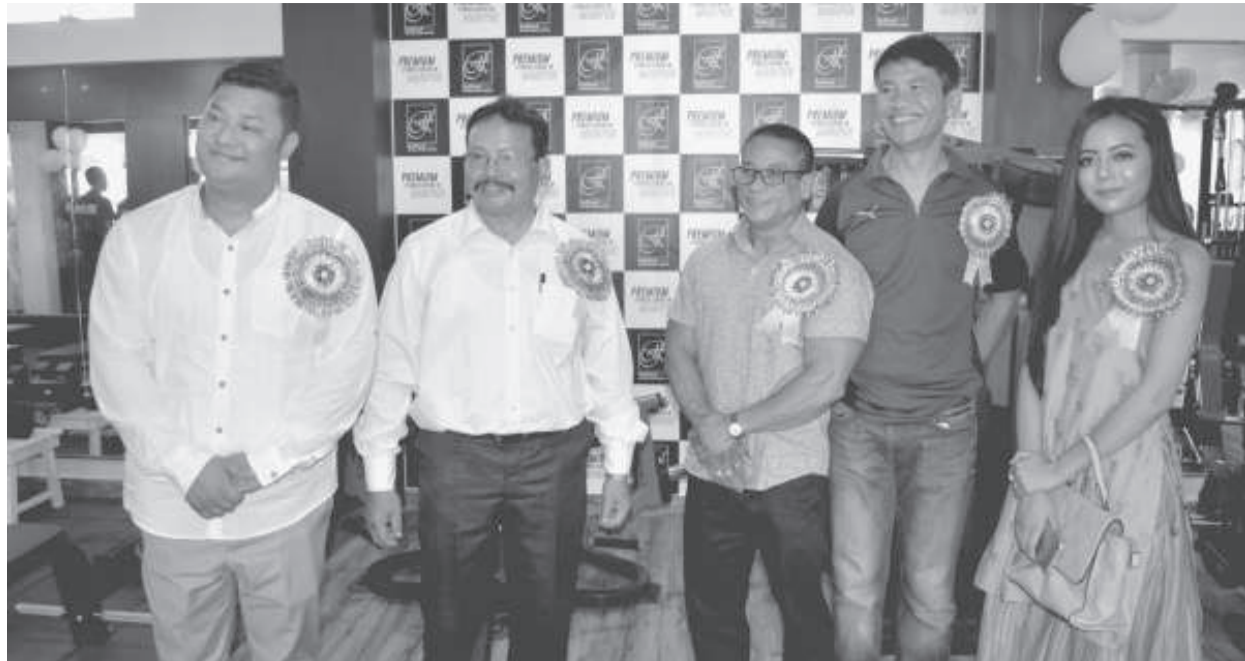
আর দি প্রাকফিল্মনা পুথোকপা রেদিএন্ট ফিটনেস সেন্টার অমা ইম্ফাল ইষ্টকী পেলেস কম্পাউন্দা হাংদোকপা ষৌরমগী শক্তম অমা

টোয়াংমো/অমাঙথোং অকোয়বদনী নাকল অমদা মচা অমা নাহুরকপা লৈবা, খোঙ হান্না খুদিংগী ঙৈ দ্রোপ দ্রোপ তারকপা, খোঙ হান্না লোয়রগসু অমাঙথোংদা য়ান্না চিকপা শাবা, পুজা য়েকপা খিনবা তৌরগা খোঙ হান্না হান্নি হান্নি তৌরগা লৈবা, শা, ঙা, খাঙ, মোরোক অমদি অতৈক অনৌ চাবা য়ান্দবা ফহনবগী ওজা এম ডি অজাদপু থাগৎচরি