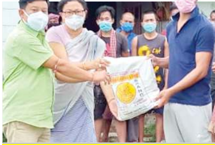
পাংশোই পাট টু অরং লেকায়গী মায়ান্না চানবা পুত্রি সিন্ধি য়াওদবদী এসেমল্লি কসটিউএসি অসিনী সোসাল বার্কৰ দল্লি দুইদেসেচননা ইলেকট্রিক তুল, ফিল্টিজি অমদি শুনুনাচিংবা মতেং পাংখিবা

কোভিডকী ২ শ্বা বেজনা ঐথোয়াদ তদ্বিৰা পারাশিং ১দি তৌরেইদবা অশোয়বশিং লামায় ২ মিনিট্টিদা শেলগী অরাংপা লেতে হায়রগা লুপা ফ্লোর ৫০০০ খক সেক্সন... লামায় ৩ কন্টেমেন্টে জোনদা লৈরিবা ইমুংশিংদা তেংবাঙী পোংলমশিং য়েজ্জেক্সে লামায় ৫ 'বাকং তাবীদ্রবদি জুলাই ২২দগী পুং ৪৮গী টেটেলে সটদাউন তৌরগনি' লামায় ৬