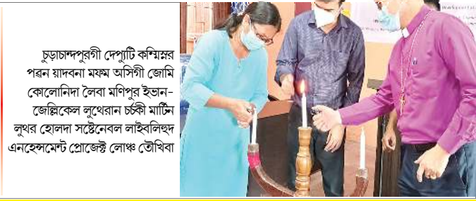
চুচাচাদপুরগী দেপাটি কম্বলের পরন য়াদবনা মফম অসিনী জেমি কোলোনিদা লৈবা মণিপুর ইভান-জেঞ্জিকেল লুথোরন চৰ্কী মাটিন লুথর হোলনা সষ্টেবেল লাইবলিথু এনহেদমেটে প্রোজেক্ট লোফ তৌখিবা

কোভিডকী ২ শ্বা বেজনা ঐথোয়াদ তদ্বিৰা পারাশিং ১দি তৌরেইদবা অশোয়বশিং লামায় ২ মিনিট্টিদা শেলগী অরাংপা লেতে হায়রগা লুপা ফ্লোর ৫০০০ খক সেক্সন... লামায় ৩ কন্টেমেন্টে জোনদা লৈরিবা ইমুংশিংদা তেংবাঙী পোংলমশিং য়েজ্জেক্সে লামায় ৫ 'বাকং তাবীদ্রবদি জুলাই ২২দগী পুং ৪৮গী টেটেলে সটদাউন তৌরগনি' লামায় ৬