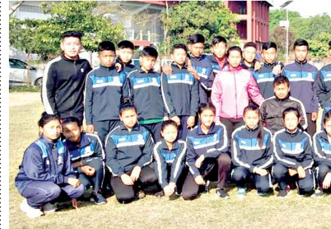
উরায়গী মখা) অমরোমদা, এহাক ইশামকসু প্লেয়ার ওইনা হৌজরকখি।

প্লেয়ার ময়াম অমা গুই-গুইরগা কপ্তৈ। ইশা ইশাগী চপ চপ চান্না খুংলায় পায়দনা শায়বা গুংগুগদি য়ান্না গুনা আর্চরিদা ঐখোয়সি মফম অমদি কনবা গুংগুগদি। রাগী টেন্দা ওইজবসু, আর্চরিসিদি গুনা মণিপূরী মচাশিংনা শানরকপ্তৈ হায়বা য়াই।