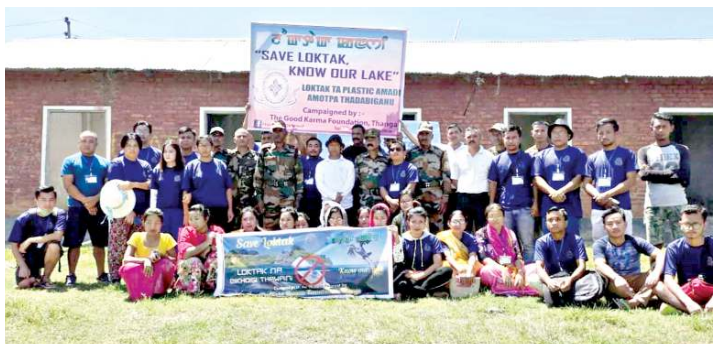
আর কে প্রলো ঐখোয়শিংসিনি। কুমজা ১৯৯১/৯২গী মতমসিদা প্লেয়ারসি খরদি অদুগা য়ান্না লৈরশ্মী। খুংলায় রাংপনা মরম ওইরগা শানবদনী পোখাখিবসু ফনা য়ান্না য়াওখি। ঐখোয় মতমদসু খুংলায় ঐখোয় মতমদসু মরম ওইরগা শানবদনী পোখাখিবসু ফনা য়ান্না য়াওখি। ঐখোয় মতমদসু খুংলায় ঐখোয় মতমদসু মরম ওইরগা শানবদনী পোখাখিবসু ফনা য়ান্না য়াওখি।

মণিপূরনা আর্চরিগী বেড অমা খঙলাক লাকপ্তিবসিদি লৈখিদ্দবি ইচে বি বসন্তি কুমজা ১৯৮২গী নাইন এসিয়ন গেমস দিল্লিদা তৌখিবসিদি শরুক য়াখিবদগী ওইখিদ্দা হায়নীই। দিল্লি এসিয়ন গেমস অসিনা মণিপূরনা আর্চরিগী অনৌবা য়াওল অমা লাকহনবা গুমখি।