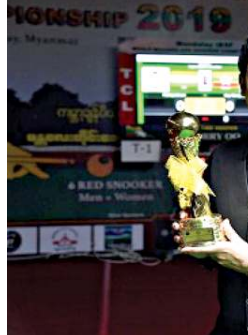
চেল্লিপয় ওইবা গুমখি।

ন্যুদিল্লি, সেপ্টেম্বর ১৫ (এজেন্সী): ম্যানমারদা পাঙথোকপা ইন্টেনসনাল বিলিয়র্দস এন্ড মুকর ফেডরেশনগী মখাদা শানবা বর্ল্ড বিলিয়র্দস চেম্পিয়নশিপকী ফাইনেলদা ময়াপাকুনা ইন্দিয়াগী পনকজ অদবানিনা টাইটল অসি থারগা পুনা বর্ল্ড টাইটল ২২ ফংদুনা অনৌবা রেকোর্দ অমা থমখ্ৰে।