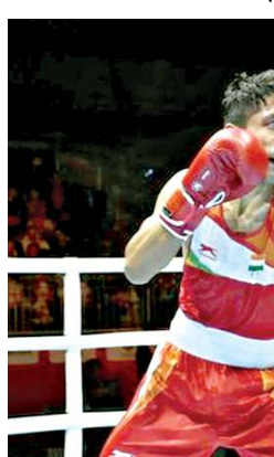
অদুগা চাইনাগী বি হাওগীনা জজ অনীনা পোইন্ট ফেবর তৌখিবা অদু য়েংনরগা ইন্দিয়াগী বোলিং অদুনা ২-৩দা ময় পাকুনা প্রি কাটর ফাইনেল য়োবা গুমখিবনি।

ইকটেরিনবর্গ, সেপ্টেম্বর ১৫ (এজেন্সী): রসিয়াদা সিটি একটেরিনবর্গতা পাঙথোকপা নুপাগী বর্ল্ড বোলিং চেম্পিয়নশিপকী গুসি শানবাখিবা কিলোগ্রাম ৫৭ কী কেটগোরিদা ইন্দিয়াগী বোলিং কবিন্দর বিষ্ট ময় পাকুনা প্রি কাটর ফাইনেল য়োবা গুমখ্ৰে।