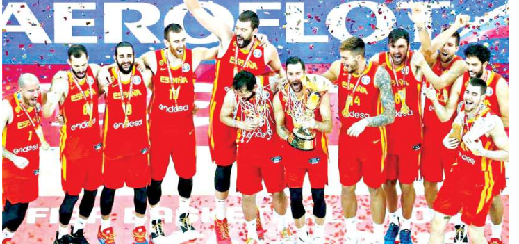
ফাইনেলদা পোইন্ট ৯৫-৮৮তা ময়খিখি।

ফাইনেলদা পোইন্ট ৯৫-৮৮তা ময়খিখি। অমরোমদা, আজ জর্ডিনানা ফ্রান্স পোইন্ট ৮০-৬৬তা ময়খিখি।