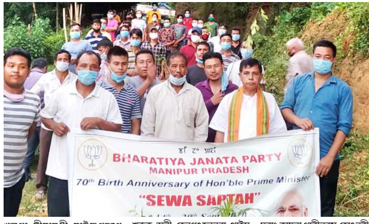
খল্লগা মীয়ায়গী য়াইফ গদগে হায়বদুসু খলহয়গি। লেইবাক অসিগী প্ৰাইম মিনিষ্টৰ নৱেন্দ্র মৌদিগী লায়ৰবা মীয়ায়গী হায়ফনবা থৌৱম থৌশিল কয়া পায়খৎলক্ৰি। লায়ৰবা মীয়ায়গী হায়ফনবা লুচিংবা অসিগী লৌখংলক্ৰি বা খোঙথাম্শি অসি শীংখামিংঙাইনি। কুম্ৰজা ২০২২ ফাওবদা লৈবাক অসিগী লৌমীশিংগী শেফোক্কা