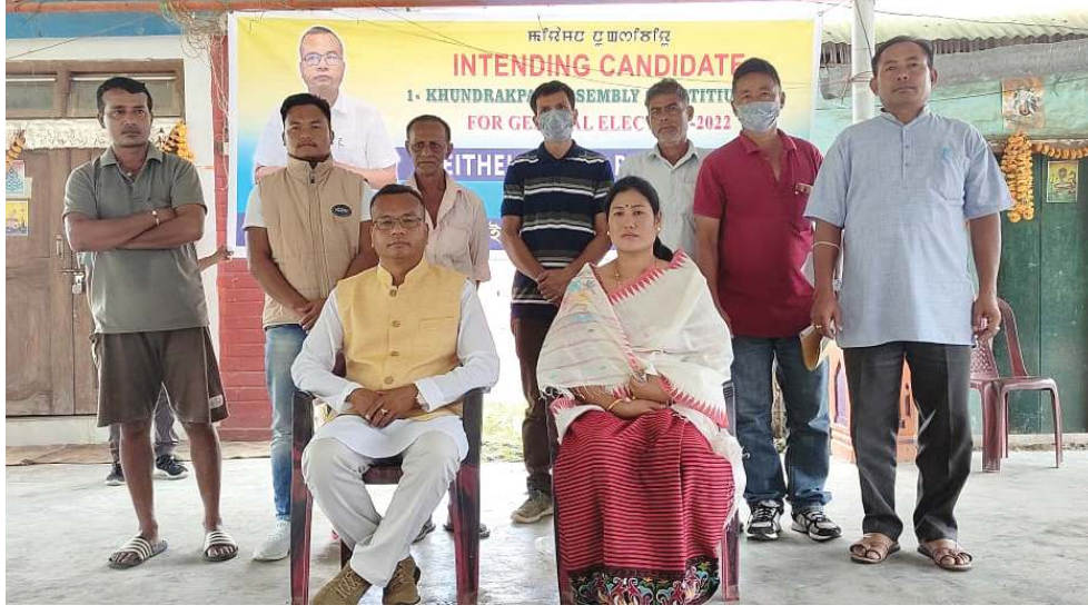
খুন্দ্রাকপম এ সীসী মনুং চনবা মোলকোন এই আইডি মাওপতা লাক্দৌরিবা এসেমব্লি ইলেগনদা এ সী অসিগী মীরেপ ওইগদৌরিবা কে রোনেনগী মীফম পাঙখোকখিবা