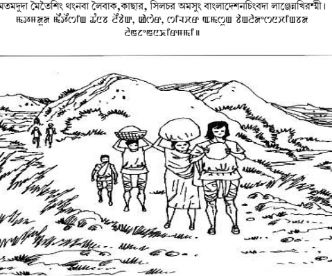
মতমদুনা মৌশৈং খনবা লৈবাক, কাছাৱ, সিলচৰ অমসুং বাংলাদেশনিংবা লাগেদাৰিশনী।