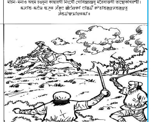
মনি-মনা ও অহম চঙদুনা কাছাৱগী নিংহৌ গোবিহুংসু মইৱাক্তী তাহেংকিৰশনী।