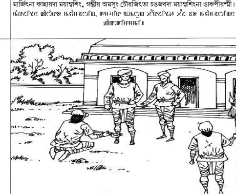
মাজিৎনা কাছাৱনা ময়াশিং, গম্বীৰ অমসুং চৌৱাজিৎতা চঙতৰদনা ময়াশিংনা ডাকৰীৱশনী।