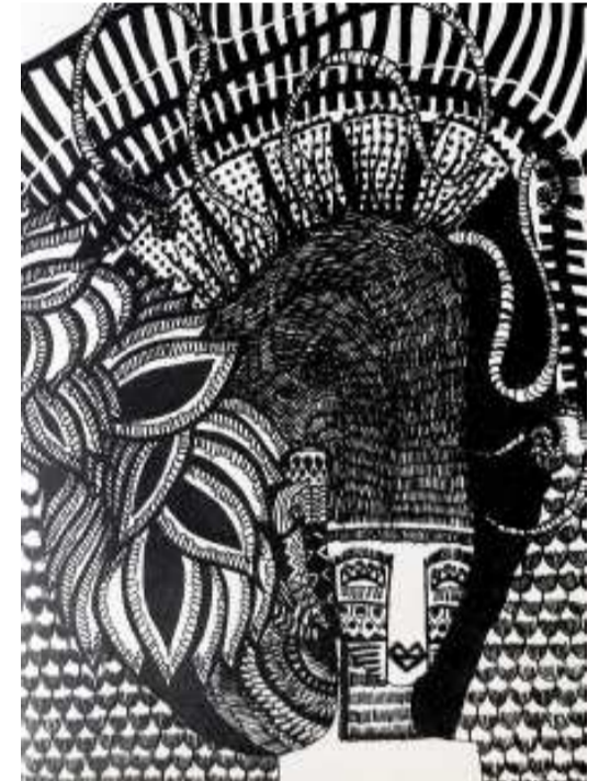
‘অনটাইটল্ড - ২’