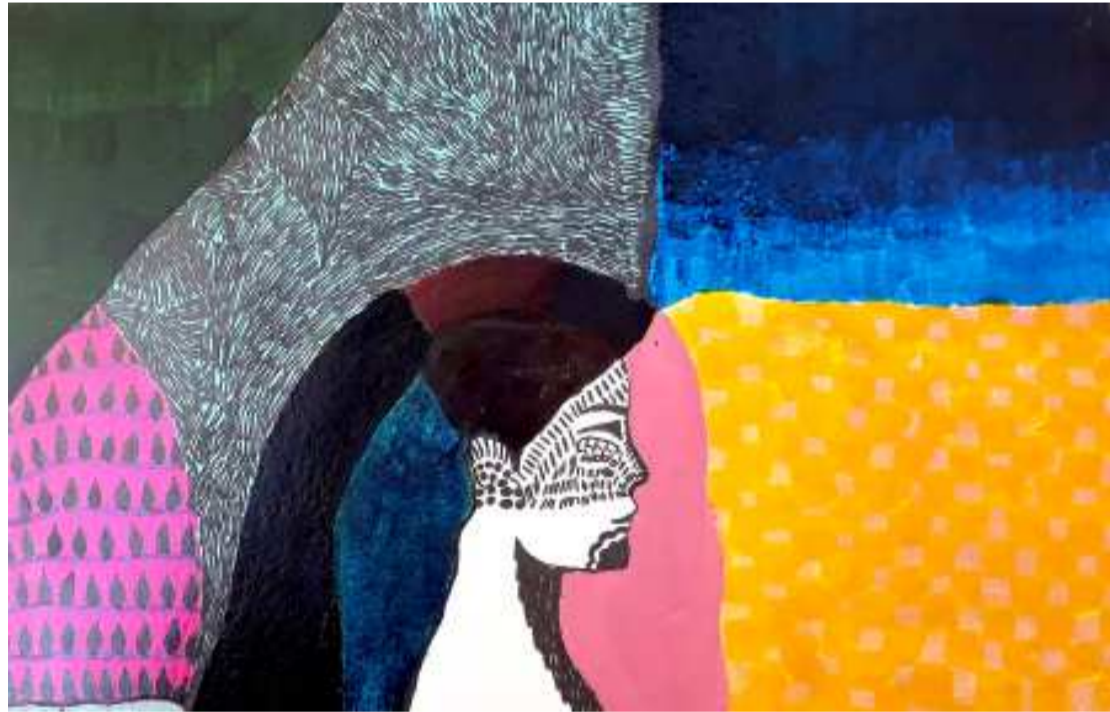
‘অনটাইটল্ড - ৩’