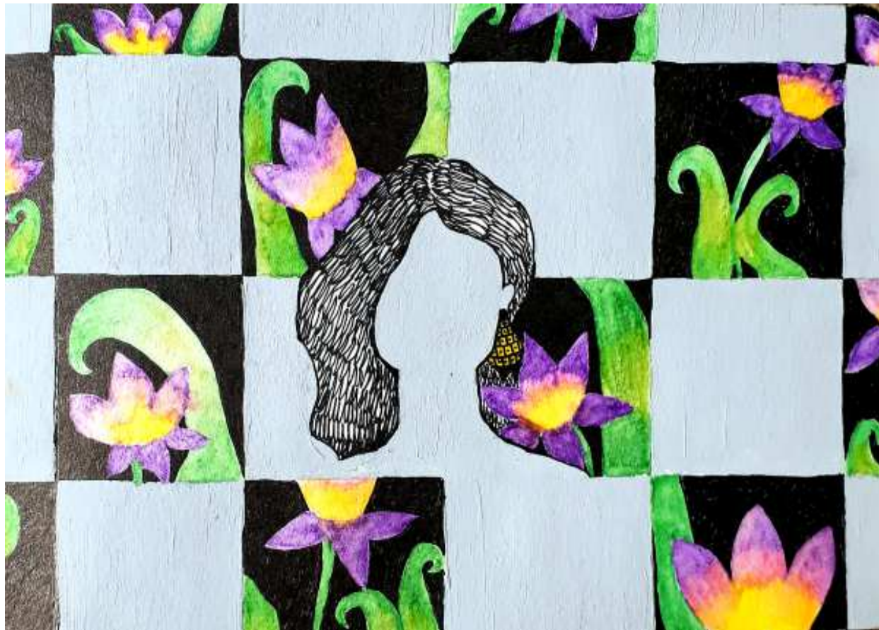
‘অনটাইটল্ড - ১’