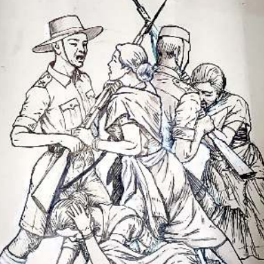
আৰ কে সী এসনা নুপী লালগী দিঞ্জাইন হৌগংলকপা