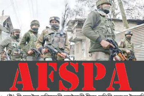
১৮ (সি) গী মতুংহুয়া কমিশনগী মায়কেন্দগী হীরম অসিগী মতুংদা ইনকারি রিপোর্টকী লায়ননা মরী লেনবা লৈজাক্ৰী ওখোরিটিদা রেকমেন্দেসন পীখম থোক্ৰেই অমসুং লৈজাক্ৰী মরী লেনবা ওখোরিটিসু থা অমগী মনুংদা নংত্রগা কমিশননা পীবা অমগী মনুংদা খবক্তা ওম্বোক্ৰুবা নংত্রগা হীরম অসিগী মতুংদা থবক লৌথংলকপগী রিপোর্ট নংত্রগা মখল অমগী কম্যুনিটেশনশিং কমিশননা পীখিবা মতম অসি হেদেব্রুবা ফাওবদা পীখংলতবনি হায়রি। অদুই হায়রিবিশিং অসি অমত্ৰ তৌরবসুগী গুরাংগী প্রেসিডেংগী মতুংহুয়া কমিশননা অমুক হুয়া প্রেসিডেং অসি ফংবা ... মখা লামায় ৩ কলম ৫