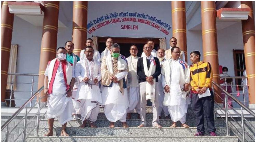
অতীকোক মরু ককরা লাইরেই ইমা লেমরেল শিবদী অমদি লাইনিংথৌ সলাইরেন শিবদা অনীগী সনা শঙ্গাই শঙ্গাবগী থৌরমদা শরুক মাখিবশিং

পায়রিবা প্রেস্টোন টিসোংনা দিসেম্বর ১৪দা প্রোজেক্টশিং অদুগী রিভিউ মাটিং পাঙথোকখি। রোদ প্রোজেক্টশিং অদু পুনা কিলোমিটার ৫৫৪.৬৭ শাংই। থোংগী প্রোজেক্টশিংদুগী মনুংদা অমনা উ মংগেট তু রেলদা পায়খংপনি অমসুং অতোপ্পদুনা চিরাটেট এরিয়াদা দামরিং তুরেলদা পায়খংপনি। মেঘালয়া ইন্টিগ্রেটেড ট্রান্সপোর্ট প্রোজেক্ট (এম আই টি পি) গী মখাদা পায়খংপা প্রোজেক্টশিং অদুগী মজা বর্ল্ড বেঙ্কনা কুম্জা ২০২০দা লুপা ক্রোর ৫৫৪.৬৭ সেক্সজন তৌখি। প্রোজেক্ট অয়ান্না কুম্জা ২০২০দা পায়খংপা হৌখি। মতম চানা লৌশিল্লগনি। ওইবনা প্রোজেক্টশিং অসিগী প্রোগ্রেস চাং নাইনা রিভিউ তৌগনি হায়না মিনিষ্টরনা মচা তাখি।