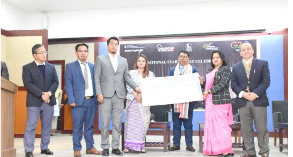
প্ৰায়ং দিপাটমেণ্ট গভৰ্ণমেণ্ট ওফ মণিপুৰনা শিন্দুনা ইফ্ৰাল হোটেলগী সঙই হোলদা পাঙথোক্কখিবা নেসনল ষ্টাৰ্ট অপ দেগী খৌৱমদা শৰুক যাবিৰশিং

মথোয়গী ৱাইটশিং মপুঙ ফানা ফংহমবা হোংনগনি হায়রি। মহাক্সা মখা তানা ফোঙদোকখিবদা, মথং থাদা পাঙথোক্কদৌৱিবা মীখল অসিদা মহাক্সী পাটিনা ৰাখল্লোন মায়াবা অতোপ্লা পাটিশিংগা চংমিন্নবাবা পান্মী অদুবু গ্রেটর তিপ্রালেন্দগী মতাংদা ৱাশিয়ৰা অমা পুৱজুনা যান চে অমা খুংয়েক পীনদ্রবদি অতোপ্লা পাটিশিংগা পুন্না থবক তৌমিন্নবগী ৰাক্ষম লৈতে। গ্রেটর তিপ্রালেন্দগী মতাংদা মহাক্সী পাটিনা মখল অমত্তগী কমপ্ৰোমাইজিটৌৱেই অমদি মসিদা অতোপ্লা পাটিগী মতেং ৱাওদ্রবসু মীখলদা লম্বা তৌনগনি। ঐথোয়গী কলটিট্ৰা সনেল ৱাইট ফংবাবা হোংনবা হায়বসি খুদিংমক্কী মথৌনি। বি জে পিনা লুচিবা লৈজক মায়থিবা পীবা হায়বসি মহাক্সী অপাৱনি হায়রি।