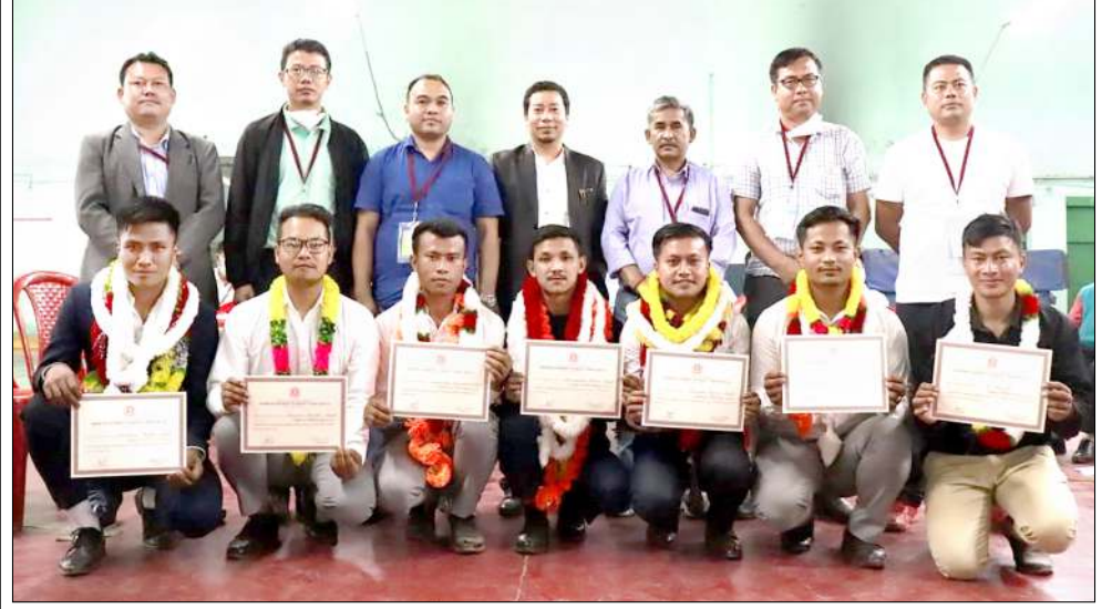
মণিপুৰ যুনিভাৰ্চিটি ষ্টুডেন্টস যুনিয়ন (মুসু)গী একাডেমিক সেসন ২০২১-২২গী যৌ পুনৰ্বী গুসি পাঙথোকখিবা মীখলদা মায় পাৰ্কাৰা মহৈৱায়শিং

পনবা যাবদি, চীফ মিনিষ্টৰ হিমন্ত বিশ্ব শৰ্মনা মমাং চহীগী মে ১০দগী ওফিস হেক পায়ৱকপদগী পুলিসকী এনকাউন্টদা মীওই ৩৯ লেখিও অমদি ৮৯না অশোক-অপন নংখনপ্ৰনি। শৰ্মনা লৈবাকপোকপা নুমিংতা এসেমব্লিদা ষ্টেট অসিদা ক্ৰাইম ৰেটহুইৰে হায়না ফোঙদোকপা লেখিবনি।