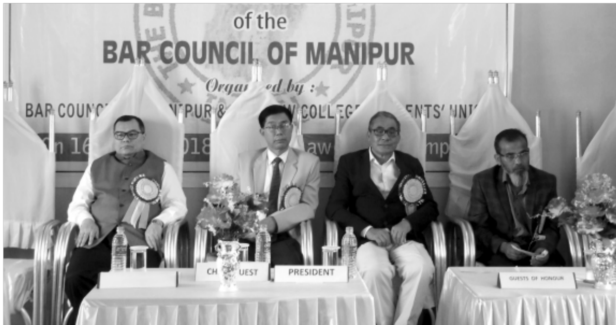
বার কাউন্সিল মণিপুরী অহমশুবা মপোক কুমওন খৌরমগা মরী লেননা পাওথোকপা ইন্টারেক্সন কম লো লোকচরর প্রোগ্রামগী শক্তম অমা