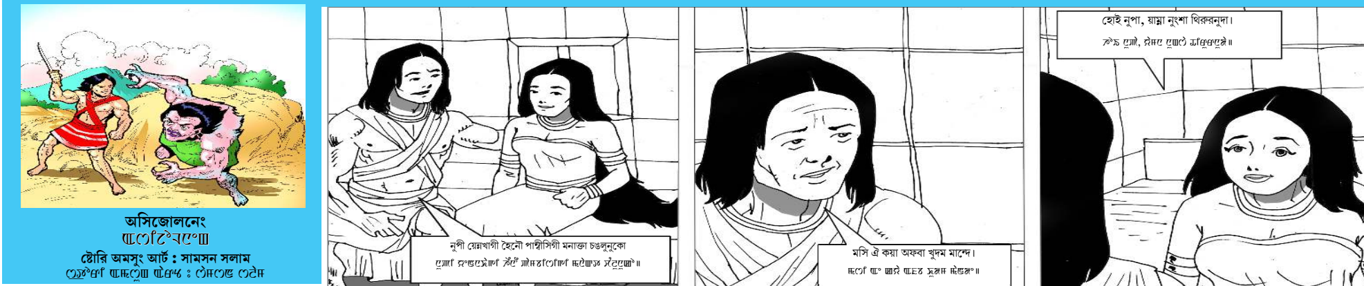
অসিজোনেং ৱেণ্টেৰেণ্ডা... ষ্টোৰি অমসুং আৰ্ট: সামসন সলাম