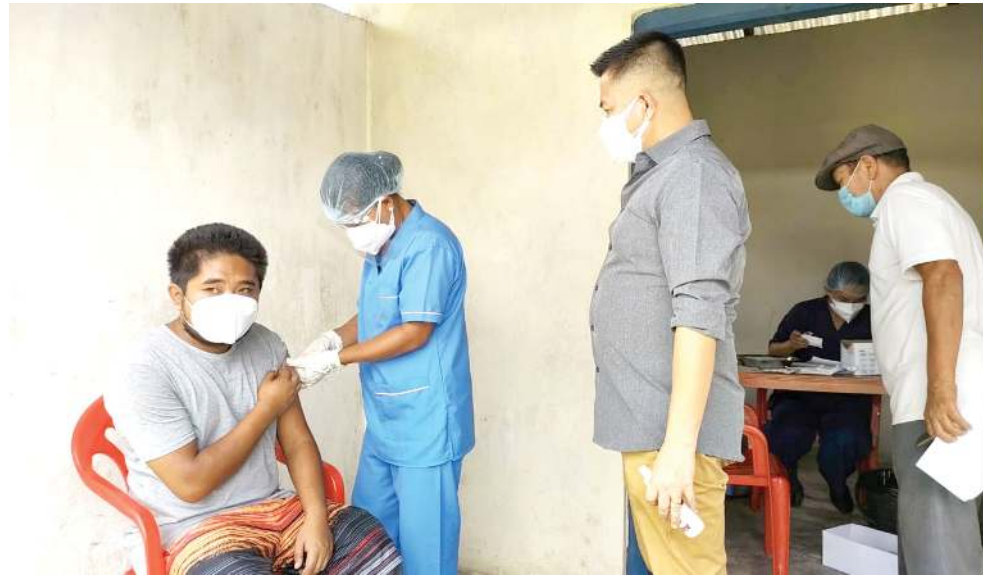
সেকমাই এসেমব্লি কন্সটিটিউয়েন্সিগী মনুং চনবা তোঙান তোঙানবা মফম মরিদা পাঙথোকখিবা কোভিড-১৯ মাস ভেক্সিনেসনগী প্রোগ্রামদা এসেমব্লি কন্সটিটিউয়েন্সি অসিগী এম এল এ ঐচ দিঙ্গেনা কোয়না চতুনা অবাং অপা য়েখিনখিবা

আইজোল, জুলাই ১৬ (এজেন্সী): হৌখিবা পুং ২৪ গী মনুংদা মিজোরামদা কোভিড-১৯ গী অনৌবা কেস ৪৫৬ থেংনশ্বেগা লায়না হৌজিক ফাওবগী ওইনা স্টেট অসিদা লায়না লাইচিং অসিদা শোকহনখিবা অপুনবা মী মশীং ২৬, ২০৭ যৌশ্বে হায়না স্টেট হেল্ঠ দিপার্টমেন্টকী ওফিসলিংনা ফোণ্ডোকখিবাগা লায়না গুসি থেংনশ্বেগা অপুনবা কেস মশীং অদুগী মনুংদা চহী নৌরিবা অগুং ১০০ হেমা গাওই হয়রি। হেল্ঠ দিপার্টমেন্টনা মখা তানা ফোণ্ডোকখিবা লায়না লাইচিং অসিদা গুসি মীওই অমা শিহনখিবাগা লায়না হৌজিক ফাওবগী ওইনা স্টেট অসিদা কোভিডনা মরম ওইয়গা মীওই ১১৭ শিহনশ্বে। নৌনা থেংনখিবা অপুনবা কেস মশীং ৪৫৬ কী মনুংদা ২৭১ দি আইজোল দিষ্টিক্ট খন্ডগীনি। স্টেট অসিদা কোভিড-১৯ গী কেস