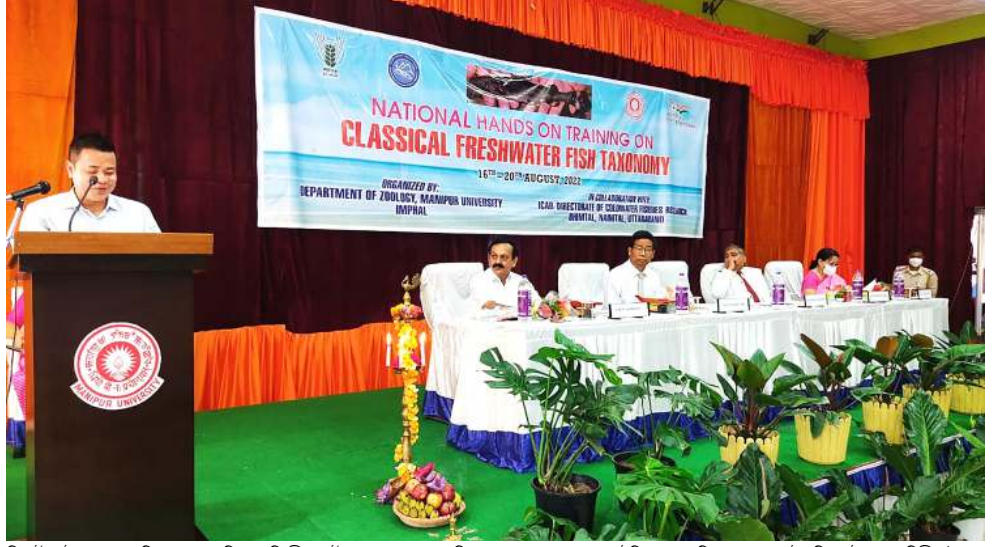
দিপাৰ্টমেন্ট ওফ জুলোজি, এম য়ুনা শিদ্ৰুনা তি সী কোট হোলদা পাঙথোকখিবা নেসনল হেপ্ৰস ওন ট্ৰেনিং ওন ক্লাসিকেল ফ্ৰেশৱাটাৰ ফিছ ট্যেক্সোনমিগী যৌৱাম

ইন্সিপ্ৰেণ্টশিগী পৰ্মনেন্ট সোলুশন অমা অথুবা মতমদা পুৰুৱ বা হোংনগদবনি। হায়রিবা অসিদা ৰাৱেইশিন অমা অথুবা মতমদা পুৰুৱবদি অব্রাং নোংপোক স্টেটিং ট্রিপুৱা অমসুং অৱনাচল প্ৰদেশতা তাৱিবা অৱাৰা অসিগুন্না তাৱেই হায়নিওই লৈতে। অমরোমদা সী এ এ অসি য়েলেহৌমিশিংগী ওইনদি য়ান্না খুদোংখিনিওই ওই। মরম অদুনা মসিগী মায়োক্তা মতম পুখ্ৰদা লেপকনি হায়রি।