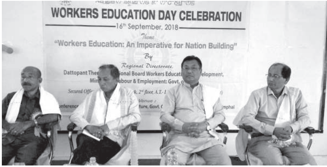
পেলেস কম্পাওন্দা লৈবা দিরেজ্টোৰেট ওফ আৰ্ট এন্ড কলচৰগী কনফাৰেন্স হোলদা পাঙথোকপা বাৰ্কৰস এদুকেসন দে খৌৱমগী শক্তম