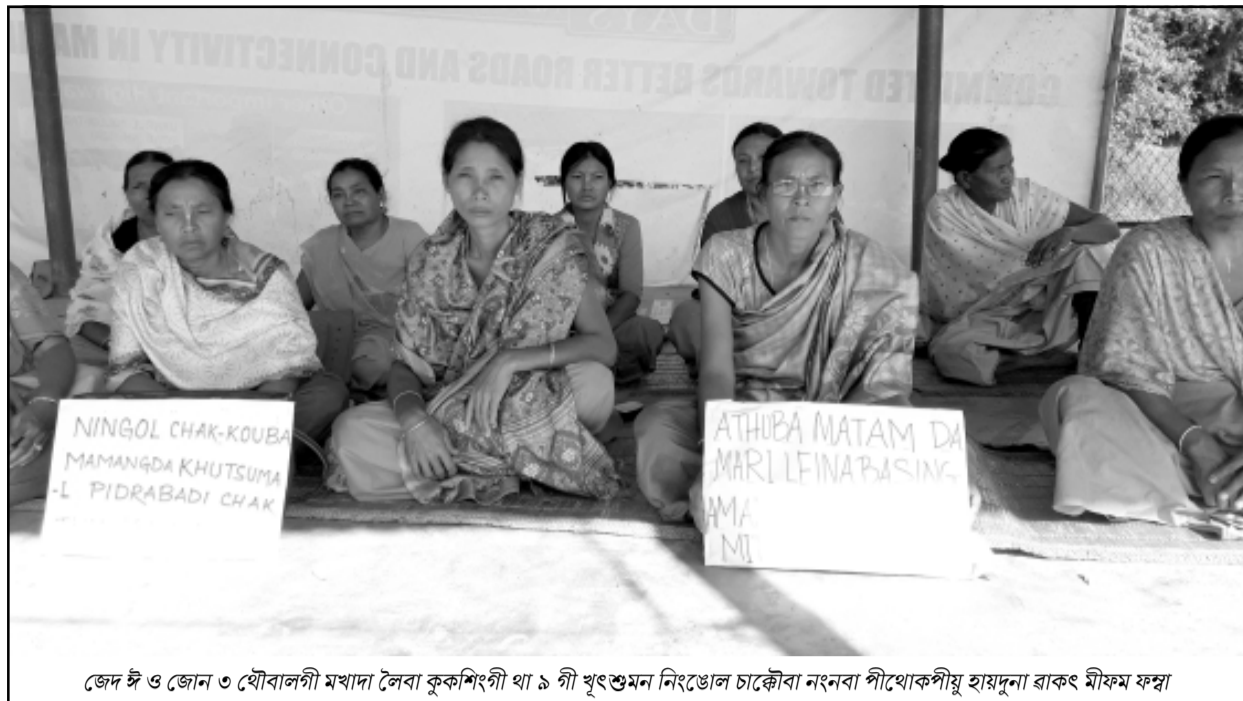
জৈদ ঈ ও জোন ও থোবালগী মখাদা লৈবা কুকশিংগী থা ৯ গী খুংশুমনি নিংঙোল চাকৌবা নংনবা পীথোকপীমু হায়দুনা ৰাকৎ মীফম ফদ্বা

ট্রাংখোঙ/অমাংথোঙ ময়াদা মতুম অনী পোমথোক্লগা লৈবা, খোঙ হায়া চাং নাইদবা, ফিটুলাদা মখুল অনী হুংলগা নাই চারকপা, মোরোক, খাউ অমদি শা-ঙা চাবা যাদবা, তাং তাং চিকপা, খোঙ খুং শজিং তোয়না হৌবগা ইফা ফাজিনবা ফহনবগী ওজা Zia-Ui-Haque পু থাগৎচরি