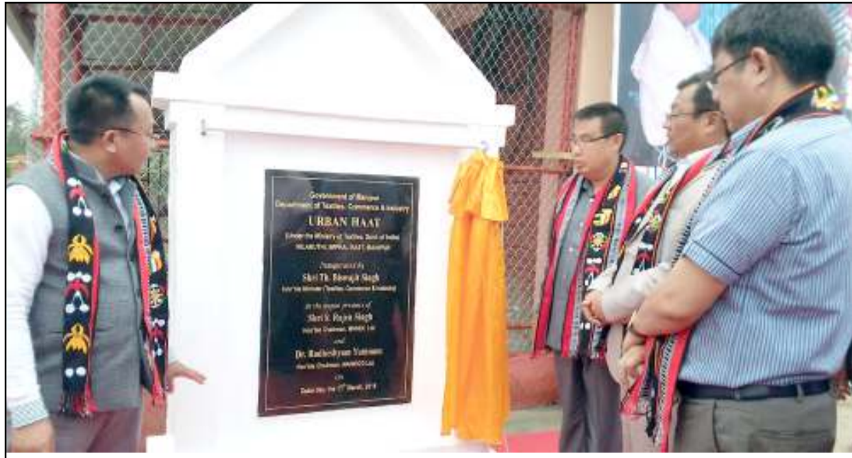
দিব্লোইট গফ হেদলুম এন্ড টেক্সটাইল মণিপূৰনা শীপুনা নিলাকুটী মণিপূৰ হেদলুম এন্ড হেদিফ্রাট কোম্পাৰেসনগী চোরেনেন এস ব্রাজেনা অৰ্বান হট শপ্ৰাবা