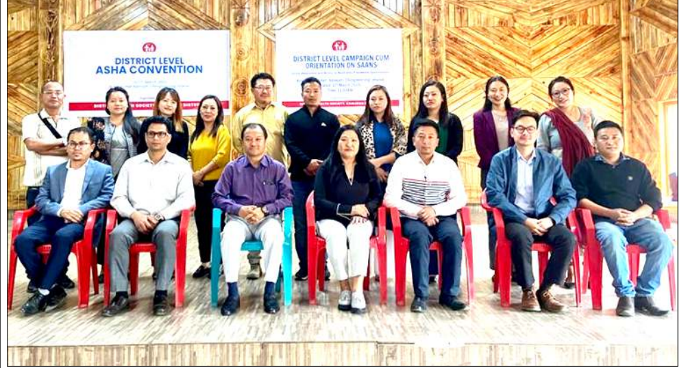
দিষ্ট্রিক্ট হেণ্ট সোসাইটি কামজোংনা শিন্দুনা চিংমৈৱোংগী অদিমজাতি কমপ্লেক্সতা পাঙথোকখিবা দিষ্ট্রিক্ট লেবেল অশা কনভেন্সন প্ৰোগ্ৰামাদা শৰুক যাবিবশিং

দিভলপমেণ্ট ফন্দগী পীগনি অমসুং অৰাংপশিং অদুনা অসাম গৰ্ভমেণ্ট টনা পুথোকনি। যৌৱম অদুনা সিএমনা খুমতাই কন্পিটিশ্বয়েলিগী বোটিকা এৰিয়াৰ্ভি ভিলেজ অদুগী মাইক্ৰো ৰাইল্ড লাইফ সেক্ৰবাৰি ওইনা লাউথোকখি অমসুং গৰ্ভমেণ্টগী নেচৰগা চাৰবা পাৰদমশিং ফক্সনৰা এৰিয়া অদুনা বনয়ান চাৰাশিং থাবগী দ্ৰাহিত অমা লোক্ৰে তোখি।