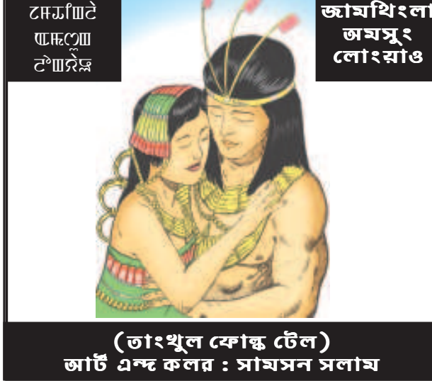
জামথিংলা জমসুং লৌংয়াও