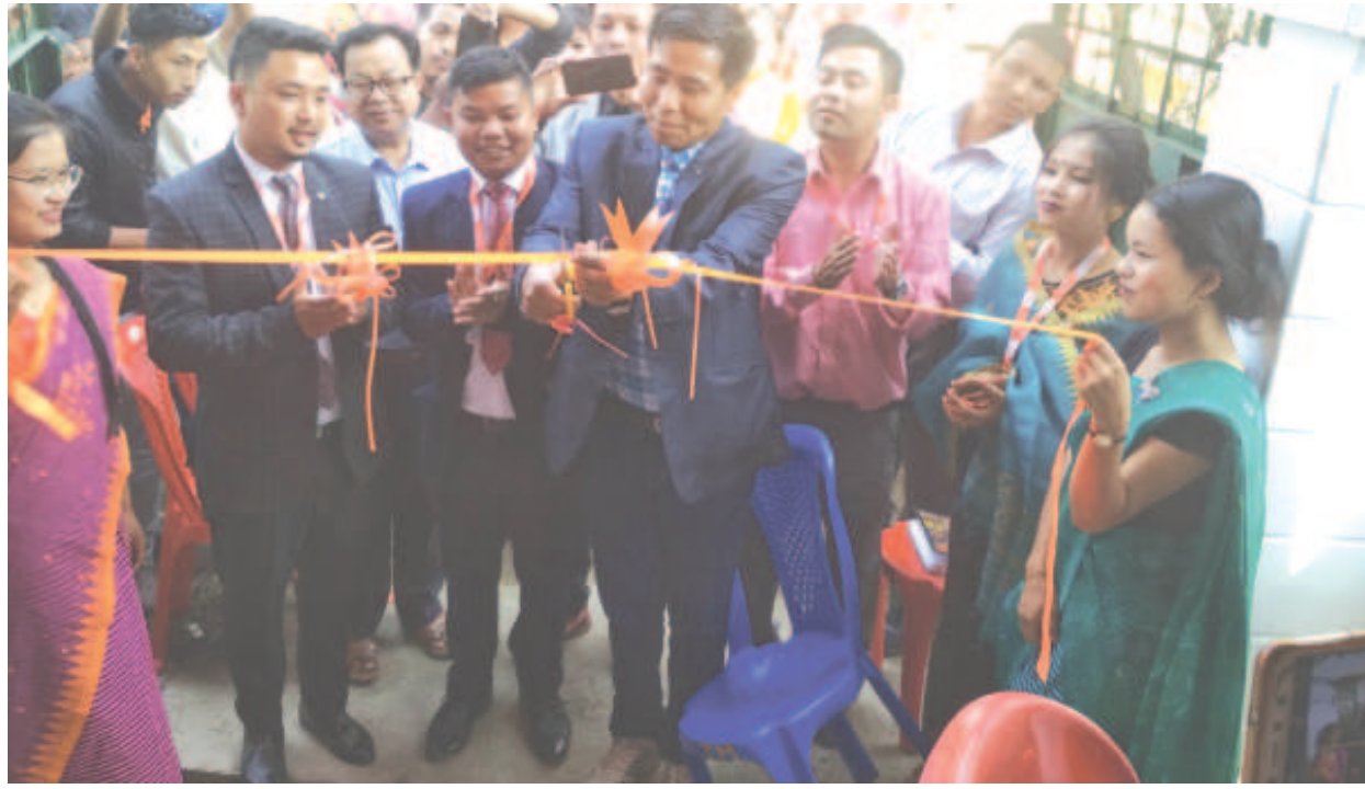
খবক শূৰ্দা অচৌবা নংব্ৰগা মচা হায়বা খায়দৌকৌইবদনি হায়বণী ৰাখলোন্দা মুফম ওইৰগা উৰিপোক তৌৰাংবম লৈকায়দা সঙই সৰ্ভিস হাংদোকপণী শক্তম