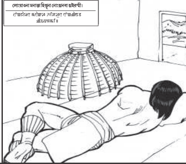
জামথিংলা জমসুং লৌংয়াও