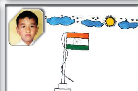
Title: Indian Flag By: N. Karnajeet Class: II School: Tiny Tots Unique School