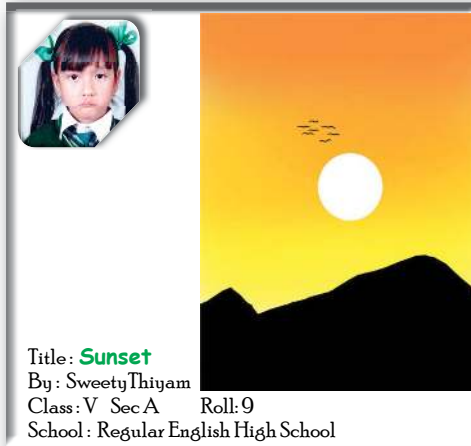
Title: Sunset By: Sweety Thiyam Class: V Sec: A Roll: 9 School: Regular English High School