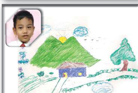
Title: Scenery By: Master Robert Class: KGRoll No. 4 School: Christ Jyoti English School