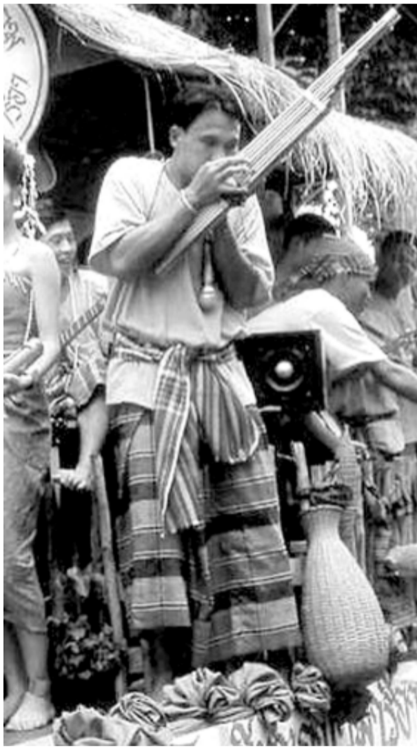
অহোংবা পুন্সমক মহৌশা লাইৱেস্তীগা খোঙচংকা চংমিৱে। হৌজিক-হৌজিক ওইৱিবা লাওস লৈবাকী ঙ্ৰীশকী শকওং অসিদা চিনাদা লৈতবা

এসিয়া কন্টিনেন্টকী লৈবাক অমা ওইৱিবা তোঙান তোঙানবা মীওই ফুৰুপশিংনা নুংশি চান্না খুন্দামিৱাৰিবা লাওস হায়ৱিবা লৈবাক অসিগী ঝাইদগী মীয়ান্না পান্নবা নাংকী মুজিক্তি মোৱ লাম হায়ৱিবা মুজিক্তি ফোৰ্ম অসিনি। লাওস হায়ৱিবা লৈবাক অসিদা টাই হায়ৱিবা মীওই কাঙলুপশিং অসিনা ময়ুম হোংলকপা মতমদগী লাওসকী মুজিক্তি ওইবা খোঙচং অসি মহৌশা লাইৱেস্তীগা চংমিৱদুনা য়ান্না তপ্পা-তপ্পা অহোংবা ময়াম অমা লাভুনা গুসিগী লাওসকী মুজিক্তি ফোৰ্ম অসি ওইৱক্ৰি। লাওস লৈবাকী ঙ্ৰীশ লাইৱেস্তীগা খুংশেম য়ান্না থুনা শেমদে মতম চংনা মহৌশা লাইৱেস্তীগা হোংলক্ৰিবা খোঙচংকী মতুংইনা লাওস মুজিক্তি