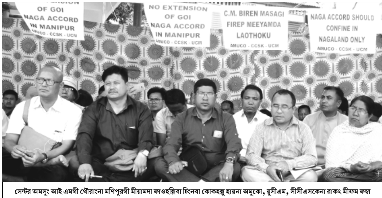
সেন্টার অফ আই এমগী থোরাংনা মণিপূরগী মীয়ামদা ফাওহাল্লবা চিংনা কোকহল্লু হায়না অমুকো, যুসীএম, সীসীএসকোনা ব্রাকৎ মীফম ফয়া

টোপথেং/অমাঙথোং মনুন্দা হম হম লাক্কাগা য়ালা চিকপা নাবা, খোঙ হান্না খুদিংগী ঈ দ্রোপ দ্রোপ তারকপা, খোঙ হান্না খুদিংগী শৌজ নাহুবা, অমাঙথোং ময়াদসু পোমথোক্কাগা লেবা, ওকশম মরি নাবা, শাগন অনি চিকপা নাবা ফহনবগী ওজা জিয়া উল হগ-পু থাগৎচরি