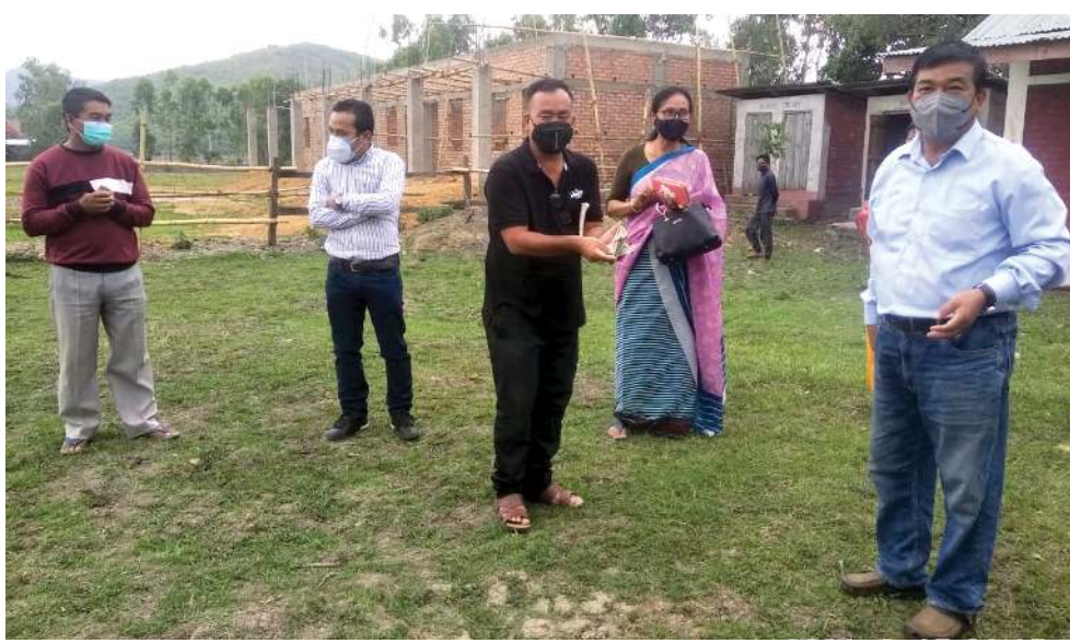
তেজৌ চান্না শেজাং গ্রাম পঞ্চায়ত মেম্বৰ অজৈম যামিনিবা লুজিদ্দা কোভিড-১৯ এৱোৱনসে এন্ড এনফোর্সমেন্ট কমিটি শেমখিবগা লায়ননা লমলাই মুনিচিপাল কাউন্সিলগী ওইনা লমলাই প্ৰাইমৰি ফ্লুদা কোভিড-১৯ পেসেটশিংনা লৈনবা আইসোলেশন সেন্টাৰ অমা হাংদোকখিবা

গুৱাহাটী, মে ১৭ (এজেন্সী): হৌখিবা পুং ২৪ গী মনুন্দা অসামগী কোভিড-১৯ গী অনৌবা কেস ৬,৩৯৪ খেংনখিবগা লায়ননা হায়রিবা মতম অসিদা লায়না লাইচং অসিনা মরম ওইয়গা মীওই ৯২ শিদিনা... (text continues)