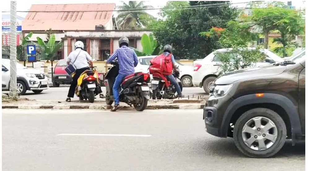
গুৱাহাটীগী ৱকমিনিগাউনদা গাড়ি থৌৱিৰশিংনা ট্রাক্কি ৱল থুগায়দুনা মগী মগী অপাৰা মওংপা থৌনিংবা মায়কৈদা গাড়ি থৌজিবগী শক্তম

য়াম্মা চেকশিনবা মথৌ তারি। হৈথিবা নুমিং ৭ নিৱোম আসিদা ষ্টেট অসিগী নোং লেপুনা চুবনা মরম ওইরগা হায়দগী হৌনা খুদাংথিবা থোক্তা যায় যাবগী ফিভা অমদা লৈরিবনি। অদুবু মেট দিপার্টমেন্টকী মতুংইয়া লাক্সিবা নুমিং খরনি আসিদা ষ্টেট অসিগী নোং লেপুনা চুরবা যাই হায়না ফোঙদোকপা লৈনবশিংনা মীয়াম্মা যাম্মা মীকুপ নাখ শিংনা লৈবা মথৌ তাই হায়না মখা তানা ফোঙদোরক্লে।