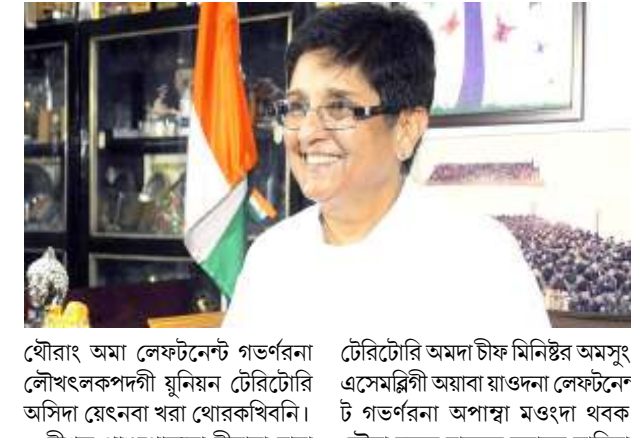
যৌৱা অমা লেফটনেট গডৰ্ণনা লৌখলকপদনী য়ুনিয়ন টেৰিটৌৰি অসিগী য়েংনবা খাৰা থোকখিবাৰি।

পুদুচৌৰি, জুন ১৭ (এজেলী) : পুদুচৌৰিগী লেফটনেট গডৰ্ণৰ কিৰন বেদিনা হায়শ্বে মদুদি, অথুবা মতমদা চীফ মিনিষ্ট্ৰেট ভি নৰায়ন স্বামিনা সেণ্ট্ৰনা চংতুনা পাৰৰ য়েহুৱেলবগী মতাংদা য়ানবা অমা পুৰকপা মথৌ তই।