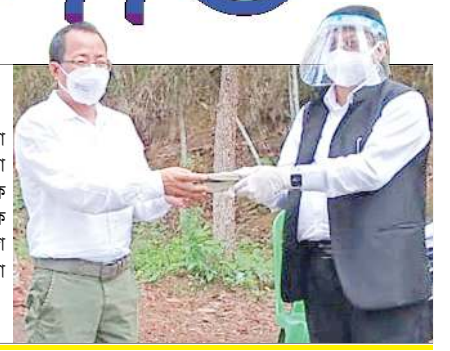
জে এন ভি সদস্য অটোবা উমাথেল, ককচিংনা নোনা হাংদোকন্নবা সী সী সীগীদমক শুগুনা এ সীগী এম এল এ, কে রঞ্জিনা মরী লেনবা ওফিসলশিংদা শেলগী মত্তেং পাংখিবা