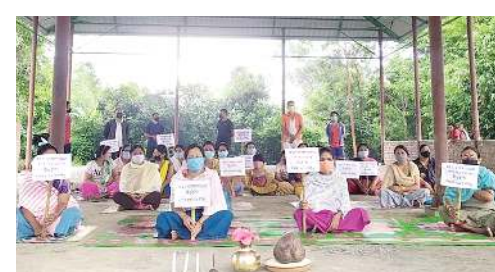
সনাজাওবনা থোরকপা চেয়েল অমদা হায়, থৌদোক অদু অখৌবা, অকি-ভুইনংইওই ওইবা থৌদোকনি। নুমীদাংরাইরম পুং ৬.৩০দগী ফাল্কি দুনা কিহন-খওহনবা, ওৎ-নেবা

ইফাল, জুন ১৭ (এচ এন এস): চংলিবা থা অসিগী ১০দা নাগামপাল কংজাবী লৈরক্তা চহী ১১ খক্ত ওইরিবি মইহেয়ানু মীচাম অমবু অহিং অমা চুপা ওৎ-নেবা অমসুং সেক্সুএল এবুজ চখরক্কনি নন-লোকলে রুপস শিবাগী চৌকো পায়ু হায়দুনা ওইখোং খুল্লেন মুখ কুব অমসুং ওইখোং খুল্লেন মৈরা পায়বী অনীনা পুরা শীন্দনা গার্ডমেন্টনা পীবা এস ও পি ডাকুনা ওইখোং খুল্লেন মনিং লৈকয় কম্মিটিটি হোলদা বাক্ব মীফম ফাখি।