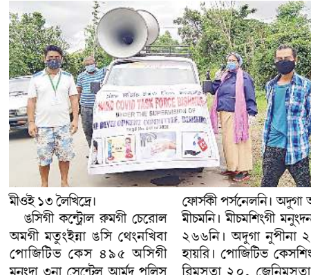
মীওই ১৩ লৈখিদ্বে

ইফাল, জুন ১৭ (এচ এন এস): মণিপুর গার্ডমেন্টকী কোভিড-১৯ কন্নম কন্ট্রোল রুনা ওরাং থোকখিবা চেয়েল অমদা ওরাংগী ওইনা পোজিটিভ কেস মশীং ৭৫২ থেংখি হায়খিবদগী হুইদ্রোম গুসিগী ওইনা হৌখিবা পুং ২৪গী মনুংদা পোজিটিভ কেস ৪৯৫ খত্তমক থেংনহে হায়রাসু নুমীং খুইদগী অয়াগা চাংবা পোজিটিভ কেসশিং থেংনরকপনা মরম ওইহুদনা গুসি ফাওবগী ওইনা কোভিড-১৯ পোজিটিভ কেসশিংগী অপূনবা মশীং ৬২, ৩৪৩ শুরে। অদুগা মসিগী নৌদা এক্তিভ কেস ৯১০২ অসিগী মনুংদা মথক্তা হৌখিবা পুং ২৪গী মনুংদা লায়না অসিদা মরম ওইহুদনা