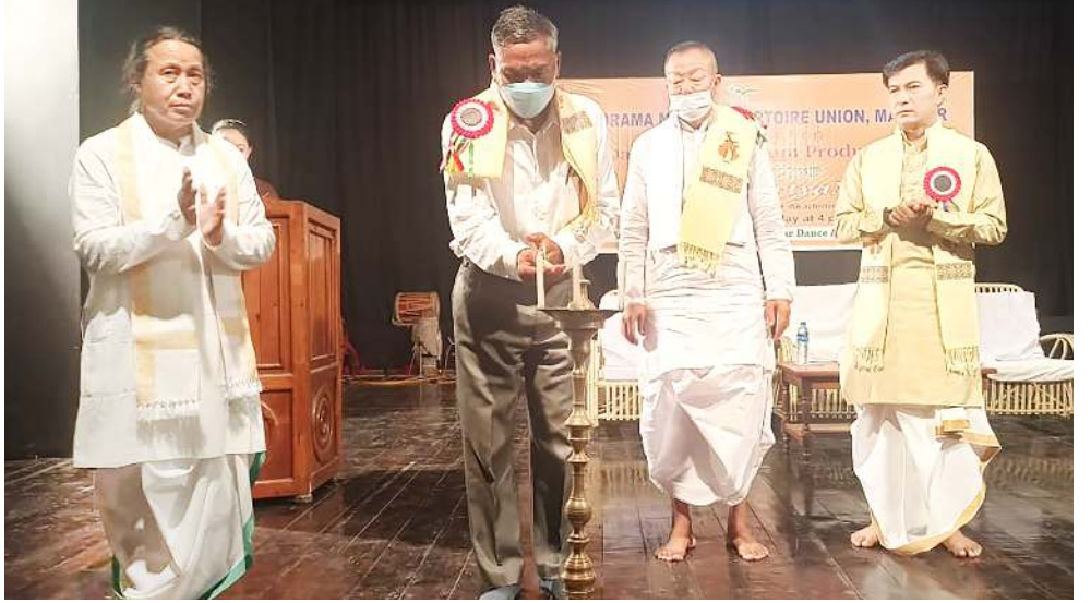
জে এন এম দি এদা পাঙথোকখিবা দাপ্ৰুমা মুজিক বিপারটৌইর যুনিয়ন মণিপুৰনা থা অমা চুপ্পা চখুদুনা লাকখিবা বার্কশোপ কম প্রদৰ্শন ওফ জগোই দীলা লোইশিনবগী যৌরম

অমরোমদা স্কুলশিংদা পীজ রিবা চীজাকশিং অসি ফবা ব্লাংলি হায়না মায়কৈ কয়াদগী কোণ্ডোফ্ৰ দুনা লাক্কিঙৈ মরক অসিদা ওসি থোকপ্ৰবা যৌদোক অসিদা মরম ওইৰগা মীয়ামদা অমুক্তা হেন্না নুংঙাইতবা পোকহল্লো। মরুওইনা গভনমেন্টনা চল্লাইবা স্কুলশিংদা অঙাংশিং লাইবক তন্ত্ৰা চংপদা মমা মপা ওইবশিং মীপাইবা ফাওনরে। লাইবক থিবা যৌদোক অসিগা মৰী লেননা হৌজিক ফাওবগী ওইনদি স্কুল থোখাৰিটি অমসুং গভনমেন্টকী মৰী লেনবা দিপাটমেন্টতগী রাফম অমত্তা ফোণ্ডদোকপা লৈরি হায়রি।