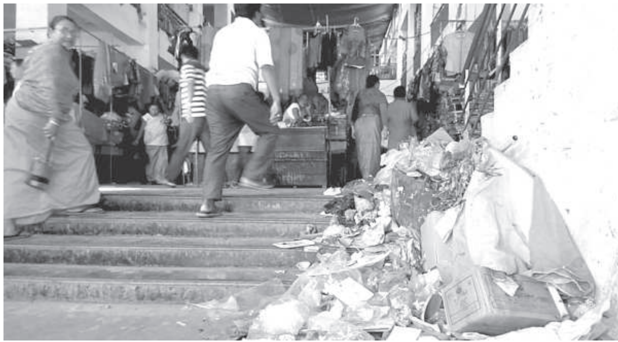
সেট্ৰেল গভৰ্ণমেণ্টৰ লৈবাকী মফম পুন্মক লু-নালহৰবা খৌৱাং কয়া পায়খলবসু অমোং-অকাই হৰবা পীক থল্লবা খৌবাল কেথেলগী ফিডম

ট্ৰাফিক/খোঙ হাৰা মতমদা অমাঙথোংদা য়ালা নাবা, খোঙ হাৰা লোয়ৱগসু অমাঙথোংদা য়ালা চিকপা অমদি শাবা, অমাঙথোংদা চাউনা পোমথোঙগা লৈবা, খোঙ হাৰা খুদিংগী ঙ্গি দ্ৰোপ দ্ৰোপ তৰকপা, পুকচপ নাবা, ওকশম মরি অমদি লেঙজুম অনীমক চিকপা নাবা ফহনবগী ওজা জিয়া উল হগপু থাগচরি