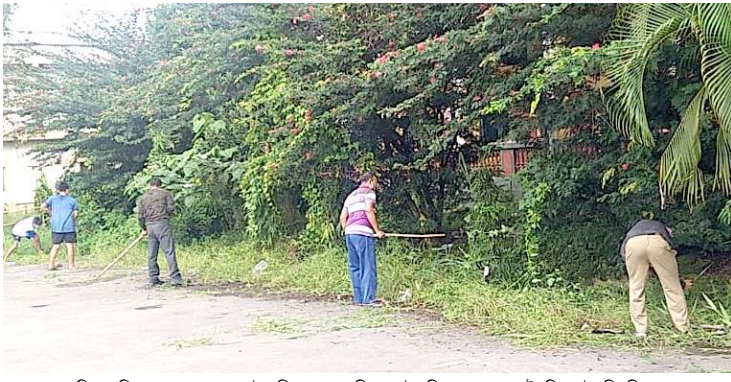
পাঙথোকখনি হায়খি। মফম অসিদা লৈরিবা পেসেন্ট-শিং অসি অরাম-অপাশিং লৈহন্দনা গুসি ফাওগা য়াদুনা নুঙইননা চেকশিনা থখীরি হায়রদুনা মনুংদা অদুমক

ককচিং, ওগষ্ট ১৭ (ঐচ এন এস): মশা-মউ ফনা, লুনা-নায়া লৈবা হায়বসিগী পাম্ভমদা ককচিং দিষ্টিক্টকী ওন্দা পুন্সিক্রা ইলিশ ফুলদা হাংখিবা কোভিড কোর সেন্টরদা লৈরিবা কোভিড পেসেন্টশিংনা গুসি সেন্টর অসিগী অকোয়বদা লাম-তু শেংদুনা লু-নায়া থমত্রে হায়রি। সেন্টর অসিদা লৈরিবা পেসেন্ট ১৮ রোগী শরক য়াদুনা পাঙথোকখিবা লাম-তু শেংদোকপা অদুগা মরী লৈননা পেসেন্ট অনা হায়খিবদা, মথোয়না লৈরিবা মফম অসিসু কুল ওইবনা মরম ওইরগা লাক্কৌদিবা অঙাংশিংগী খঞ্জগা অমদি মখা তানা মফম অসিদা লাক্কৌদিবা অনাবশিংগী য়েংলগা মথোয়নসু মখা তানা লৈজহৌবদা লু-নায়া লৈনবা অমদি মফম অসি তঙ-তনামা থম্বা পাদমদা গুসি লম-তু শেংদোকপগী যৌরম অসি