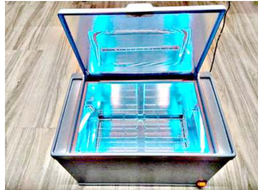
UV সেনিটাইজর অমগী মমি

কোরোনাভাইরাসতগী গাকথোকবগী পাইপ্লেসিংগী মনুংদা হৈজিক শীজিমরিবা ভেজিন অসিসু মতিক চাবা ওইরি, হায়বদি মসি চহী কাঙলুপ খুদিংমজ্ঞী মীশিংদা কাপ্লা যাদে, খুদম ওইনা অঙাংশিং, হায়পারইম্যুনা দিসওবরশিং লেবা অমসুং ইম্যুনোসপ্ৰেসেন্টশিং শীজিমরিবা মীশিংদা শীজিমবগী খুদোংচাবা লৈরি।