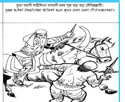
তুদা অৱাগী লাম্বিখিনা অসামগী মফম পুপা তপ্পা তপ্পা লৌশিল্লকশী