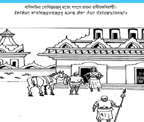
বাগিচাউনা গোবিন্দচন্দ্ৰমত্বে পাংগে হায়না য়াৱিৰকিবশী