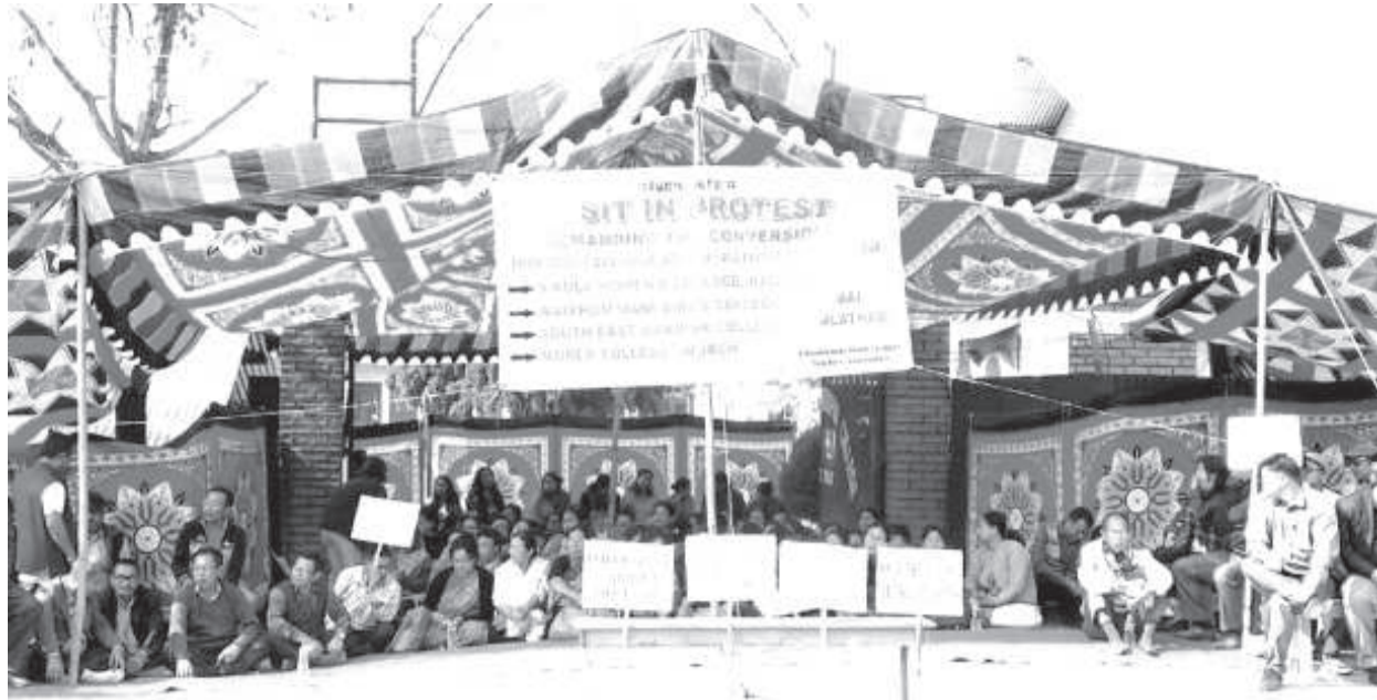
এদেদ কোলেজ মরি লৈঙাক্সা লৌশিনবীনবা তকশিন্দুনা চাদেদে দিষ্টিক্কী কোল্লাখাবীদা লৈবা সাউথ ইষ্ট মণিপুৰ কোলেজগী গেটতা বাকং মীফম ফব্বগী শত্ৰম

টোম্বাংমোৰ্ণ/অমাঙথোংদা কোবিলৈ শাংপঙলা পোমথোক্ৰপা লৈবা, পোমথোক্ৰপা অদুনা মরম ওইদুনা য়ান্না নাবা অমদি ফব্বা ওমদবা, খোঙ হান্না খুদিংগী অমাঙথোং ময়াদদী পিচকারিনা কাপ্পঙলা ঈ কাপথোরকপা, খোঙ হান্না মতম কুইনা চংবা ফহনবগী ওজা জিয়া উল হকপু থাগৎচরি