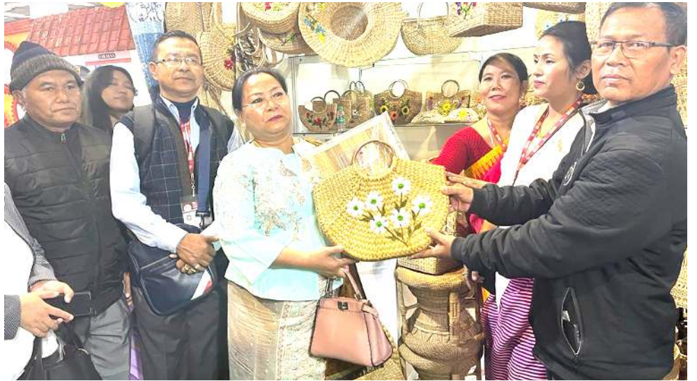
নু দেক্সিগী প্রাগতি মৈদান এমফি থিয়েটার পাঙথোকপা ৪১ শুরা ইন্দিয়া ইন্টারনেশনাল ট্রেড স্ট্রাইটলস মিনিষ্টর নেমচা কিপগেনদা খুদোলশোং পীবা

অমরোমনা স্টেট অসিদা লৈরিবা মীয়ান্না উ পান্দি থাবগী হৈনবগী থমসি। মহৌশাগী কায়থরক্লিবা খল অসি কনবা ঐখোয় খুদিংমক্সা হোংনমিসি। লৈঙাকখঙদা ইছোকপা হায়বসি অফবা থবক নন্তে। মরম অদুনা ঐখোয় উ চারা অমত্তা ওইরবসু থাসি হায়রি।