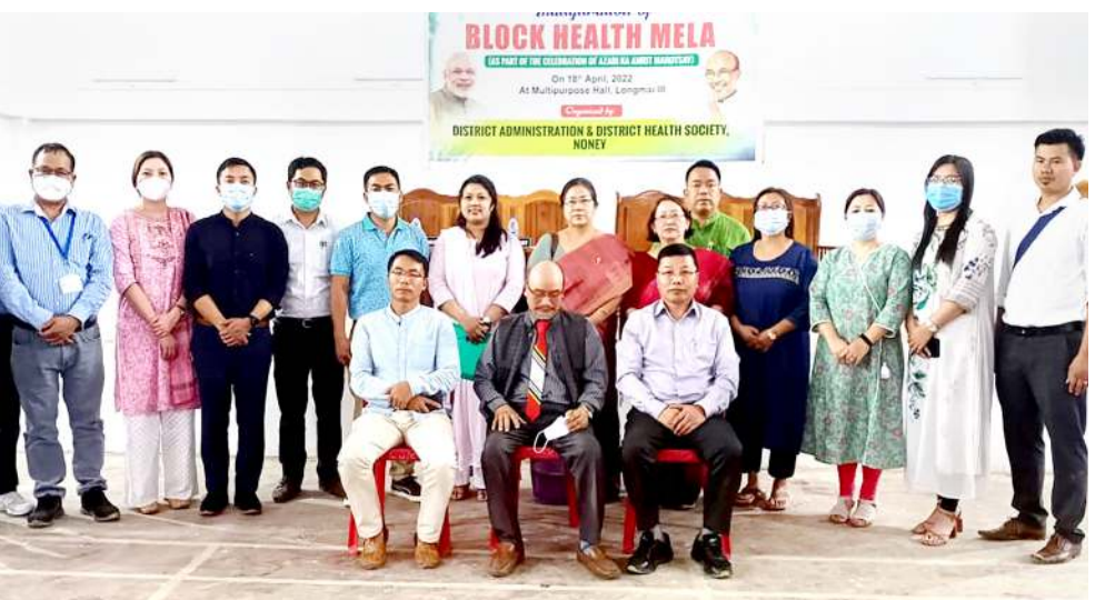
দিষ্টিক্ট এডমিনিস্ট্রেশন এন্ড দিষ্টিক্ট হেলথ সোসাইটি, নোনো শিন্দুনা লোংমাই-৩ দা পাঙথোকখিবা ব্লক হেলথ মেলাগী য়োরমদা শুরক য়াখিবশিং

কোলাসিব, এপ্রিল ১৮ (এজেন্সি): অসামগী ডুমখৈগা তাইনবা শুরহাটি লৈবাক মিজোরামগী কোলাসিব দিষ্টিক্টতা ওয়াং অহিং অথংবদা চুখিবা লেন যাওবা অকনবা নোং চুরবা য়ারি শিহনপ্রে ওফিসল শিহনপ্রে ওফিসল শিহনপ্রে