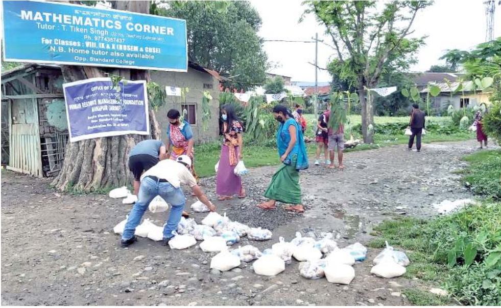
থেংজু এ সীগী কৰ্টেমেন্ট জোন লাউথোকৰখা মফমশিংনা এ সী অসিগী ইন্টেন্দিং কেণ্ট্ৰিট প্ৰেসিওজিং শংলাকপমনা চানা থকুবা পোংলমশিং য়েহোকৰখি।