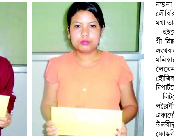
হুইয়ন লানপাউ স্পোর্টস কুইজ নম্বর ৪৯ গী রিয়ার ওইরবা মুতুম মালেমঙানবা