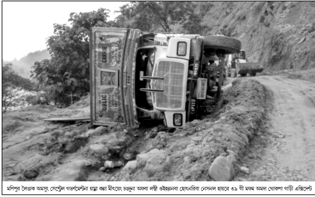
মণিপুর লোক অসম স্টেট গভর্নমেন্টা যান্না ক্বা মিংয়েং চল্পুনা অফবা ল্পী ওইহানবা হেংনরিবো নেসলন হায়রে ৩৯ গী মফম অমদা থোকপা গাড়ী এঞ্জিনেট