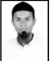
থাংচরিবো