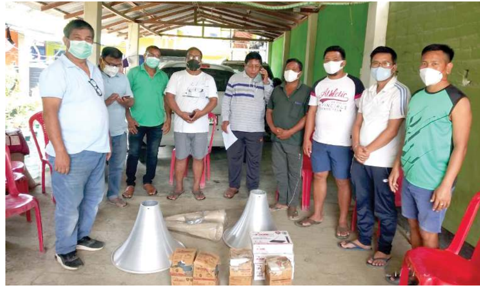
থেংজু ও সীগী মনুং চমা লৈবা লোকেল ঋবশিৎনা কোভিড-১৯ গা মরী লেনবা রাফমশিং খঙহুয়া হোংনবা শীজিননা লাউ পি়কবশিং মিনিষ্টর বিয়াজিৎনা দি সোসাল বার্কস কোংগ্রেস, খোঙমন ওরেন্টেন ঋব অমদি খোঙমন ষ্টুডেন্টস ঋবকী যৌমিশিৎনা বুংশিনাথিবা

সিক্কিম হেল্থ দিপার্টমেন্টনা ফোন্ডদোরকপগী মতুং ইয়া স্টেট অদুদা হৌখিবা পুং ২৪ গী মনুংদা কোভিড-১৯ গী অনৌবা কেস ১৫৫ থেংনখিবগা লায়ননা হায়রিবা মতম অসিদা লায়না লাইচং অসিনা মরম ওইরগা মীওই ৩ শিশুনখি হায়রি।