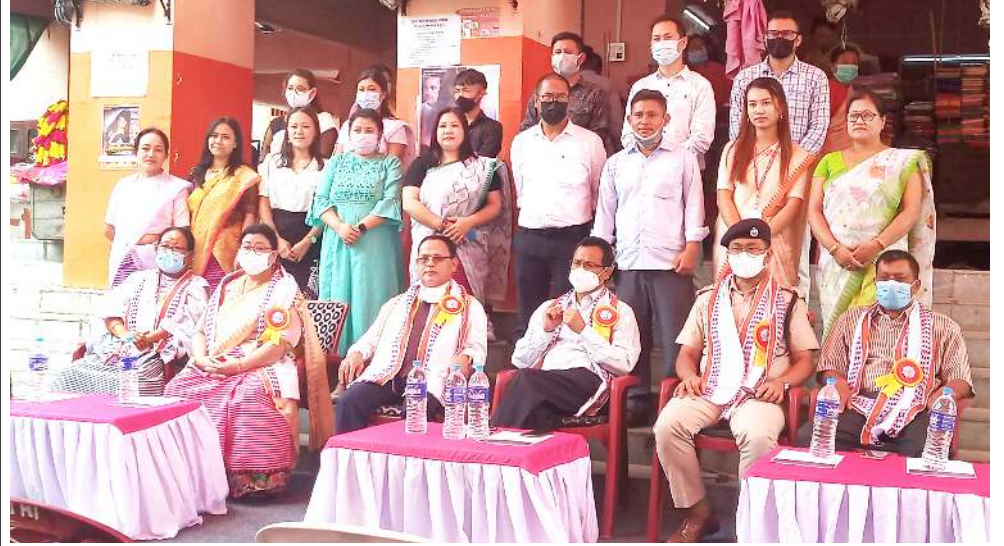
কৰ্কিনাস হেণ্ট কোৱ নোৰ্থ ইষ্ট প্ৰাইভেট লিমিটেড অমদি স্বাইৰমবন্দ ইমা কৈখেলনা খুংশম্ভৰগা কৈখেল অসিদা কোৱৰগী স্কুনিং বুথ অমা হাংদোকপদা শৰুক য়াখিবশিং

ৰাৰিশিং তারবা মতুং ত্ৰিপ্রা ষ্টুডেন্ট স ফেডৰেশনগী থোমীশিং অদুনা হোষ্টেল ৰাৰ্দেন কোথোক্তুনা বারী শায়রবা মতুং অসিগুস্তা থোওংশিং মখা তানা তৌহদনবা অকনবা ৰাৰ্নিং তৌখিবগা লোয়ননা মখা তানা কমপ্লেন লাক্কবদি হায়র ওখোৱিটদি ৰাক্কুনা থবকগী লৌথোক্কনি হায়সু খঙহল্লমখি হায়রি।