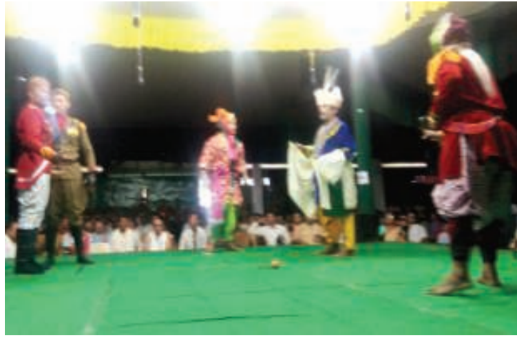
গুণ্ট ১৩ অসিদা মহৌশাঙম তোঙান-তোঙানবা এষ্টৰ পুনা এষ্টৰ ৩৬ শৰুক য়াখিবা লীলা অসি কোন্সু মমাঙদা লৈবা শুম্ৰাঙ লীলা শঙলেন্দা উংখি।

গুণ্ট ১৩ অসি মণিপুরগী পুৰাৰীদা য়াম্মা মৰুওইবা নুমিৎ অমা ওইদুনা লাঙ্কি। নুমিৎ অসিদা হায়বদি ১৮৯১ গী গুণ্ট ১৩ দা মণিপুরগী নীংতদ্দগী নুমিৎ তাখি। মনীং মখা তন্না লৈরঙ্গা মণিপুরগী লৈঙাজা মীতোপকী খুং চঙশিল্লকুনা খোংজোমগী অরোইবা লানফমদা থৰায় থাশ্ৰবা পাওনা, চিংলেনসনানচিংবা অথৌবা কয়া তুশ্ৰবা মতুংদা কংলাদা মণিপুরগী ফিৰাল চিংখুদনা বৃটিশকী ফিৰাল য়ুংখি। মতম খৰা ৰায়োল চখুদনা লাঙ্কবদা, মৰৈবাক মরমদমগীদমক থৰায়না পোস্তা পীশ্ৰবা বিৰ টিকেড্ৰজিং (কোইরেংসনা) অমদি থাঙ্গাল জেনৰেলবু ফৈদাপুঙদা পুথোজুনা মীয়াম পুন্মকী মাঙদা বৃটিশনা মঙজা খৌরি থুদনা হাংখি। মসিগী মৰুওইবা মরমদি বৃটিশকী মায়োজা লাল হৌই হায়বগী মৰালগা লোয়ননা বৃটিশ ওফিসৰ ৫ ৰায়োল তৌদনা হাংখি হায়বগী মৰালদনি। ৰাফম অসি নাকন্দা থল্লগা মৰুওইবা মরম অমা হায়বা তারবদি নিংখৌ মচ মশেলগী মরজ মুৰুবা লাঙ্কখিবা, নিংখৌ ফম্বাল মুৰবগী হৌরকখিবা ঠৌদো মহাৰাজ সুরচন্দ্রবু নিংখৌ ফম্বদগী চিংখরগা কুলচন্দ্রবু নিংখৌ খুভম শিল্পখিবা অসিনি। মসিগী হৌরকফম ওইরিবনা পোকামিদগা মচিন-মনাও ওইরিবা সুরচন্দ্র, পকাসনা অমদি কুলচন্দ্র, তিকেড্ৰজিং, জিলাঙম্বা, অঙৌসনা মথোয়গী মরজা থোকখিবা মুৰবশিংদগীনি হায়না পুৰাৰীদা লাভমদা ইৰি। পুন্মক ওইরিবসু বৃটিশনা ইন্দিয়া হায়না খঙনরিবা নিংখৌ পানবা লম পুন্মক খুদম চন্দুনা মথং মথং লোই চল্লকপদা অপিকপা চাংনা কোইশিনবা মণিপুরবু খুদম চয়নবা লস্বী থিরকপদা সুরচন্দ্রগী মায়কৈদা তোংখিন্দুনা বৃটিশনা তিকেড্ৰজিংপু ফানবা লাল্লোং শিল্লকপগী মখা তারকপদা ওইরকখিবি হায়বা অসিনি।